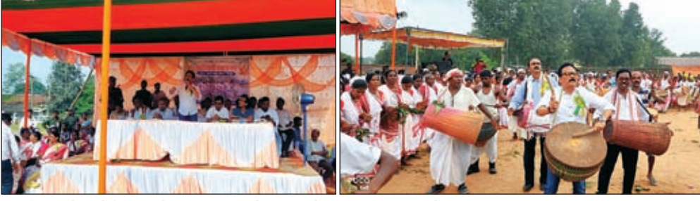
कार्यक्रम को संबोधित करते सांसद तथा खोड़हा दल के साथ नगाड़ा बजाते सांसद व अन्य

चैनपुर। आदिवासी एकता मंच चैनपुर द्वारा रविवार को प्रखंड स्थित बरवे स्कूल मैदान में सांस्कृतिक कार्यक्रम का आयोजन किया गया। कार्यक्रम में आदिवासी समाज की अनमोल सांस्कृतिक धरोहर और उनके अधिकारों के प्रति हमारी सम्मान और प्रतिबद्धता को प्रकट किया गया। इस अवसर पर सांसद सुखदेव भगत ने कहा कि आदिवासी समाज ने हमारे देश की सांस्कृतिक विविधता में महत्वपूर्ण योगदान दिया है। उनकी पारम्परिक ज्ञान, कला और जीवन शैली हमें प्रकृति के साथ सामंजस्य पूर्ण जीवन जीने की प्रेरणा देती है। उनका अनुभव