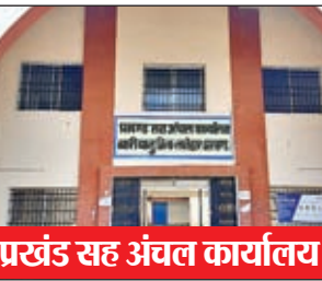
प्रखंड सह अंचल कार्यालय