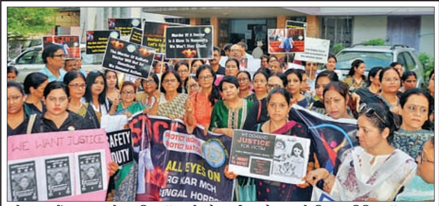
कोलकाता में एक स्नातकोत्तर प्रथम्य डॉक्टर के यौन उत्पीड़न और हत्या के खिलाफ विभिन्न डॉक्टर संगठनों के सदस्यों का विरोध प्रदर्शन

कोलकाता। आरजी कर मेडिकल कॉलेज में महिला ट्रेनी डॉक्टर से रेप और मर्डर का मामला गरमाया हुआ है। इसे लेकर सिर्फ बंगाल ही नहीं देशभर में विरोध प्रदर्शन हो रहे हैं। इस बीच महिला ट्रेनी डॉक्टर की मां कहा कि हॉस्पिटल से फोन आया था कि बेटी की तबीयत खराब है, फिर कहा उसने आत्महत्या कर ली है, जब मैं हॉस्पिटल पहुंची तो पहले तो डेड बॉडी को देखने नहीं दिया और फिर जब इजाजत मिली और देखा तो उसकी पैट खुली थी, शरीर पर सिर्फ एक कपड़ा था। हाथ टूटा पड़ा था और मुंह तथा आंखों से खून निकल रहा था। उन्होंने कोलकाता पुलिस के काम पर भी असंतोष जताया और कहा कि ऐसा लगता है कि सीएम ममता बनर्जी विरोध रोकने की कोशिश कर रही हैं। महिला ट्रेनी डॉक्टर की मां का कहना है कि अस्पताल प्रशासन का