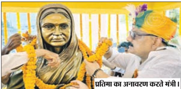
प्रतिमा का अनावरण करते मंत्री।

के लिए प्रेरणा का स्रोत बनेगा। उन्होंने पाल महासंघ के पिछले कार्यक्रम में गढ़वा में महारानी अहिल्या बाई की प्रतिमा लगाने का वादा किया था, वह आज पूरा हो गया है। ऐसी विरांगना नारी पर सभी को गर्व होना चाहिए। उन्होंने कहा कि पाल समाज कहीं से भी कमजोर नहीं है, यह समाज अपने हक, अधिकार के लिए किसी से