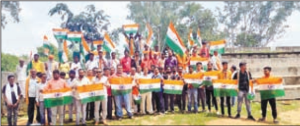
तिरंगा यात्रा में शामिल लोग