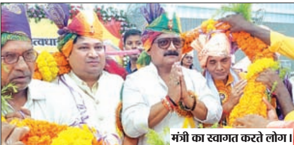
मंत्री का स्वागत करते लोग।

गढ़वा। गढ़वा विधायक झारखंड सरकार के पेयजल एवं स्वच्छता मंत्री मिथिलेश कुमार ठाकुर मंगलवार को नीलांबर-पीतांबर बहुद्देश्यीय सांस्कृतिक भवन के समीप महारानी अहिल्या बाई होल्कर की प्रतिमा का अनावरण किया। पाल महासंघ गढ़वा के तत्वावधान में उनकी पुण्य तिथि पर टाउन हॉल में आयोजित कार्यक्रम का उद्घाटन मुख्य अतिथि के रूप में उपस्थित गढ़वा विधायक झारखंड सरकार के पेयजल एवं स्वच्छता मंत्री मिथिलेश कुमार ठाकुर ने दीप जलाकर किया। तत्पश्चात महारानी अहिल्या बाई की प्रतिमा का अनावरण कर माल्यार्पण किया। साथ ही टाउन हॉल परिसर में स्थित नीलांबर-पीतांबर की प्रतिमा पर माल्यार्पण किया। इस