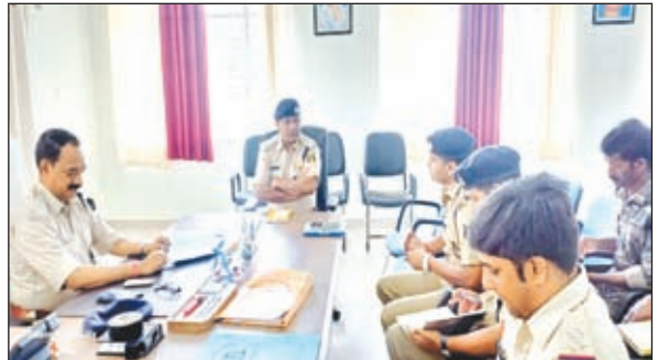
बैठक करती पुलिस प्रशासन