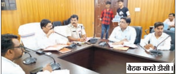
बैठक करते डीसी।