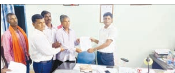
सीओ को आवेदन देते ग्रामीण