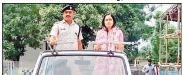
पूर्वाभ्यास करते डीसी व एसपी