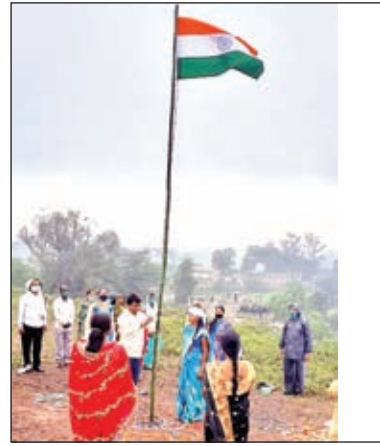
ओरमांडी में ध्वजारोहण (फाइल फोटो)।

ओरमांडी। स्वतंत्रता दिवस 15 अगस्त को प्रखंड क्षेत्र के प्रमुख स्थानों में ध्वजारोहण करने की समय सारणी जारी कर दिया गया है। इसे लेकर मुख्यालय में प्रखंड क्षेत्र के पदाधिकारियों व जनप्रतिनिधियों की एक बैठक की गई थी। जिसमें प्रखंड मुख्यालय, थाना सहित विभिन्न प्रमुख स्थानों में ध्वजारोहण की समय में कहीं-कहीं परिवर्तन किया गया है। साथ ही ध्वजारोहण चबूतरा को उजला रंग से रंगने व झंडा बांधने व ध्वजारोहण करने के दौरान महिलाओं को सिर पर साड़ी रखने व पुरुषों को टोपी पहन कर पूरे सम्माम के साथ ध्वजारोहण करने को कहा गया है। निर्धारित समय सारणी में प्रखंड-सह-अंधल कार्यालय में सर्वप्रथम सुबह आठ बजे ध्वजारोहण होगी। जिसके बाद