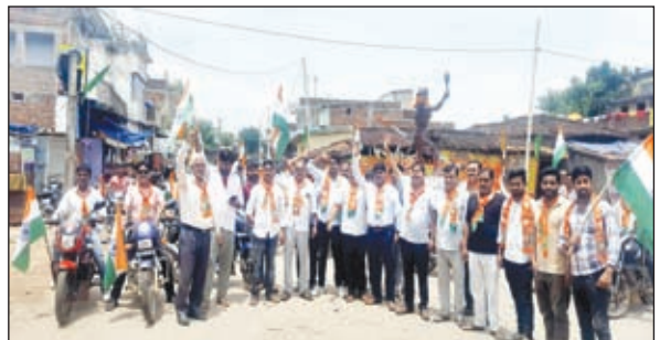
तिरंगा यात्रा में शामिल लोग