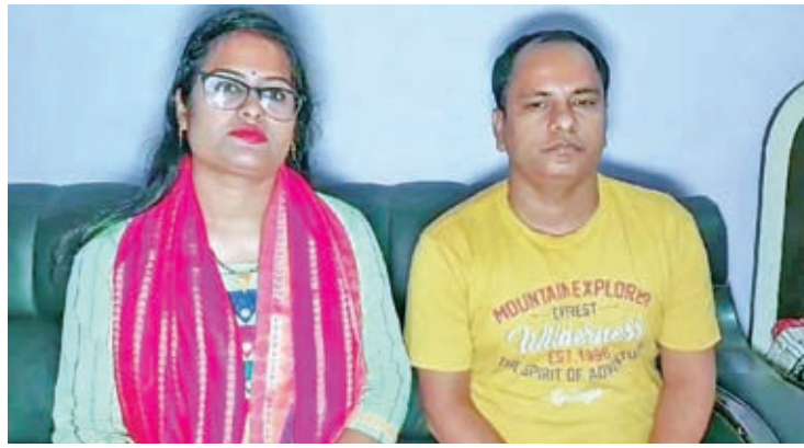
रांची अपने घर लौटने के बाद उन्होंने बताया कि पड़ोसी मुल्क बांग्लादेश की हालत काफी खराब है। उन्होंने कहा, वे लगातार भारतीय दूतावास और झारखंड सरकार के भी संपर्क में थे। जब तक वे लोग रांची नहीं पहुंच गए तब उनकी पल-पल की जानकारी भारतीय दूतावास से और झारखंड सरकार के द्वारा ली जाती रही।