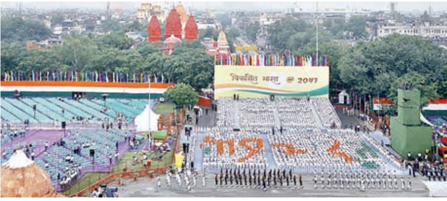
स्वतंत्रता दिवस को लेकर लालकिले पर फुल ड्रेस रिहर्सल में जवान और छात्र।

अतिथि के तौर पर आमंत्रित किया गया है। बुधवार को ग्रामीण विकास मंत्री शिवराज सिंह चौहान उन्हें सम्मानित करेंगे। नमो ड्रोन दीदी और लखपति दीदी योजनाएं ग्रामीण क्षेत्रों में महिलाओं के बीच आर्थिक सशक्तीकरण और वित्तीय स्वायत्तता को बढ़ावा देने के लिए सरकार की महत्वपूर्ण पहल में से एक है। नमो ड्रोन दीदी योजना के तहत, ड्रोन की खरीद पर महिला स्वयं सहायता समूहों (एसएचजी) को सब्सिडी प्रदान की जाती है। वहीं, लखपति दीदी एक ऐसी एसएचजी सदस्य है जिसकी वार्षिक आय एक लाख रुपये या उससे अधिक है। पंचायती राज मंत्रालय की एक विज्ञापित के अनुसार इससे पहले इन विशेष आमंत्रित सदस्यों को पंचायतों में महिला नेतृत्व विषय पर बुधवार को