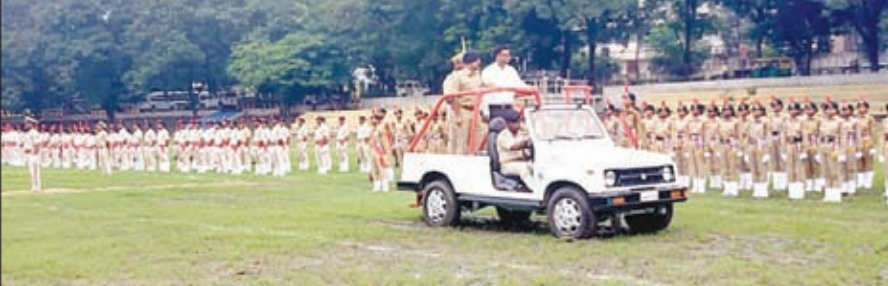
गोपाल मैदान में फूल ड्रेस परेड का निरीक्षण करते एडीएम और रूरल एसपी।

जमशेदपुर। स्वतंत्रता दिवस के अवसर पर जमशेदपुर के गोपाल मैदान में जिला स्तरीय मुख्य समारोह का आयोजन किया गया है, पूर्वाह्न 9:05 बजे झंडोतोलन किया जायेगा। जिला प्रशासन की ओर से समारोह की तैयारी पूरी कर ली गयी है। समारोह को लेकर परेड में शामिल टुकड़ियों ने अंतिम