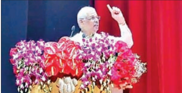
को दिलाई गई शपथ को दुहराते हुए उन्होंने कहा कि यदि इस शपथ को हम सभी अपने अंदर उतार ले तो हमें दूसरे किसी चीज की जरूरत नहीं पड़ेगी। चार साल की पढ़ाई आपके आने वाला समय को तय करेगा। राज्यपाल ने नई शिक्षा नीति के महत्व को रेखांकित करते

पूर्वी चंपारण। जिला मुख्यालय मोतिहारी शहर के राजा बाजार स्थित बापू सभागार में मंगलवार को महात्मा गांधी केन्द्रीय विश्वविद्यालय के दीक्षारंभ समारोह में बतौर मुख्य अतिथि राज्यपाल राजेन्द्र विश्वनाथ आर्लेकर पहुंचे। यहां उन्हे गार्ड ऑफ ऑनर दिया गया। इसके बाद राष्ट्रगान से कार्यक्रम की शुरुआत की गई। मंच पर बतौर विशिष्ट अतिथि क्षेत्रीय सांसद राधामोहन सिंह मौजूद थे।