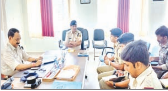
बैठक करती पुलिस प्रशासन