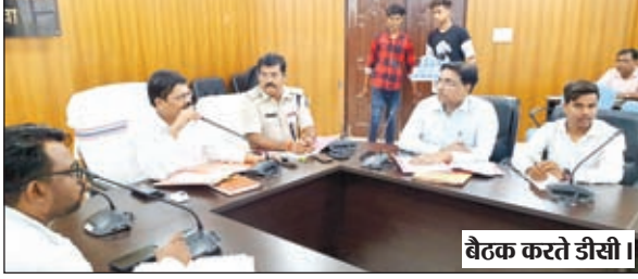
बैठक करते डीसी।