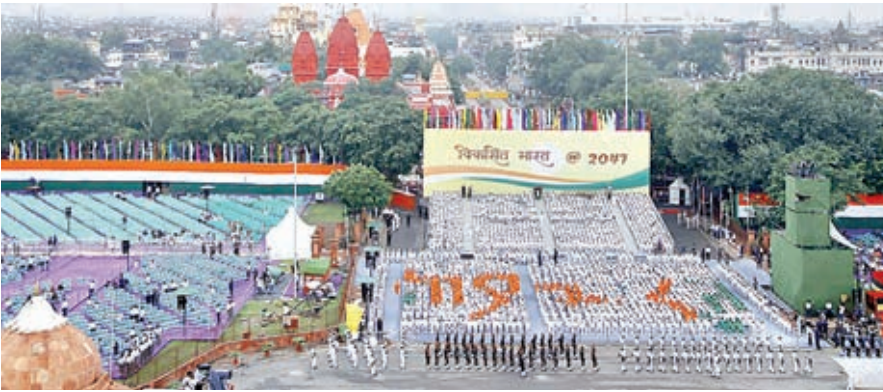
स्वतंत्रता दिवस को लेकर लालकिले पर फुल ड्रेस रिहर्सल में जवान और छात्र।

अतिथि के तौर पर आमंत्रित किया गया है। बुधवार को ग्रामीण विकास मंत्री शिवराज सिंह चौहान उन्हें सम्मानित करेंगे। नमो ड्रोन दीदी और लखपति दीदी योजनाएं ग्रामीण क्षेत्रों में महिलाओं के बीच आर्थिक सशक्तीकरण और वित्तीय स्वायत्तता को बढ़ावा देने के लिए सरकार की महत्वपूर्ण पहल में से एक है। नमो ड्रोन दीदी योजना के तहत, ड्रोन की खरीद पर महिला स्वयं सहायता समूहों (एसएचजी) को सब्सिडी प्रदान की जाती है। वहीं, लखपति दीदी एक ऐसी एसएचजी सदस्य है जिसकी वार्षिक आय एक लाख रुपये या उससे अधिक है। पंचायती राज मंत्रालय की एक विज्ञापित के अनुसार इससे पहले इन विशेष आमंत्रित सदस्यों को पंचायतों में महिला नेतृत्व विषय पर बुधवार को