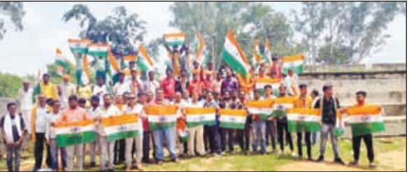
तिरंगा यात्रा में शामिल लोग

खबर मन्त्र संवाददाता चंदवा। 78 में स्वतंत्रता दिवस के मौके पर आजादी का अमृत महोत्सव कार्यक्रम के तहत चंदवा मंडल भाजपा कमेटी के द्वारा मंगलवार की दोपहर बाइक तिरंगा यात्रा निकाली गई। यात्रा की शुरुआत स्थानीय खेल स्टेडियम से हुई जो सरोज नगर, मिशन स्कूल, इंदिगा गांधी चौक, चंदवा बाजार, सुभाष चौक होते पूरे शहर का भ्रमण किया, नगर भ्रमण के उपरांत यात्रा चंदवा के गुरी टांड स्थित धरती आबा भगवान बिरसा मुंडा के स्मारक स्थल पहुंची जहां प्रतिमा पर माल्यार्पण व पुष्पांजलि के बाद कार्यक्रम का समापन किया गया। यात्रा के दौरान