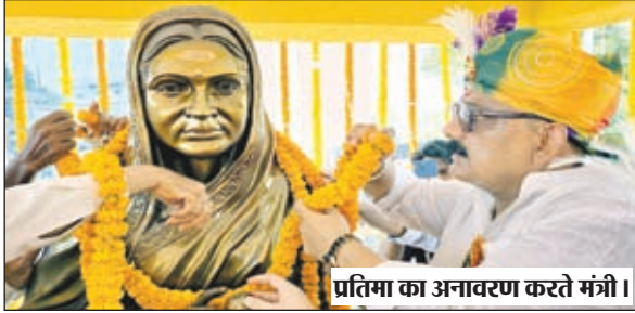
प्रतिमा का अनावरण करते मंत्री।

के लिए प्रेरणा का स्रोत बनेगा। उन्होंने पाल महासंघ के पिछले कार्यक्रम में गढ़वा में महारानी अहिल्या बाई की प्रतिमा लगाने का वादा किया था, वह आज पूरा हो गया है। ऐसी विरांगना नारी पर सभी को गर्व होना चाहिए। उन्होंने कहा कि पाल समाज कहीं से भी कमजोर नहीं है, यह समाज अपने हक, अधिकार के लिए किसी से