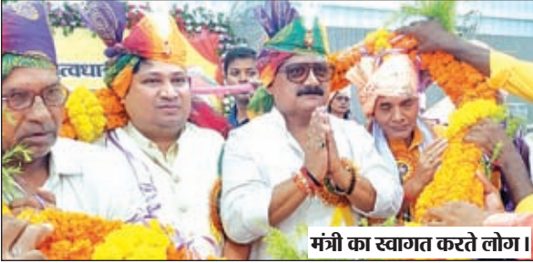
मंत्री का स्वागत करते लोग।