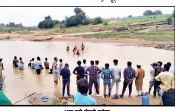
शव को ढूँढते लोग