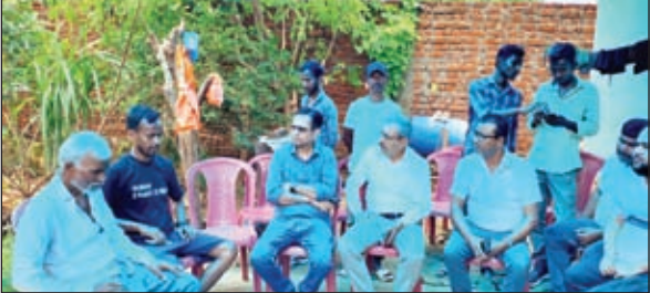
जांच करती पुलिस