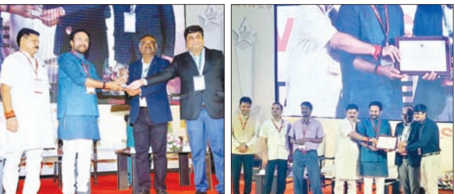
नोआमुंडी माइंस के पदाधिकारी अवार्ड ग्रहण करते और जोड़ा ईस्ट आयरन माइंस के पदाधिकारी अवार्ड ग्रहण करते।