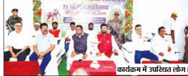
कार्यक्रम में उपस्थित लोग।