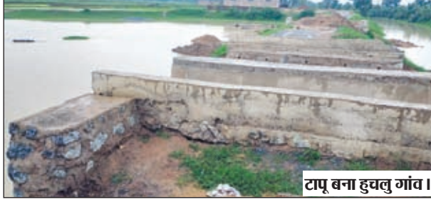
टापू बना हचलु गांव।

चंदवा। चंदवा प्रखंड के बारी व बनहरदी दो पंचायतों के ग्रामीणों का जीवन इन्दिनों कष्टमय हो गया है। दोनो पंचायत अंतर्गत आने वाले हचलु, छतासेमर, बारी, रेन्ची, बनहरदी, सुरली, डडैया समेत कई गांवों के ग्रामीणों को स्वस्थ, शिक्षा व रोजगार जैसे मूलभूत कार्यों के लिए आवागमन करने में जद्दोजहद करनी पड़ रही है। सबसे बुरा हाल तो हचलु ग्राम है जो टापू में तब्दील हो गया है व यहां की लाभग दो हजार की आबादी को जरूरी कार्यों के साथ साथ खेती बारी, स्कूल आवागमन