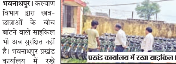
प्रखंड कार्यालय में रखा साइकिल।