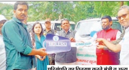
परिसंपत्ति का वितरण करते मंत्री व अन्य।