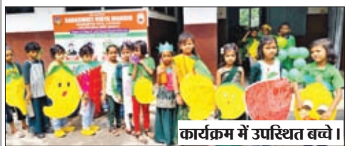
कार्यक्रम में उपस्थित बच्चे।