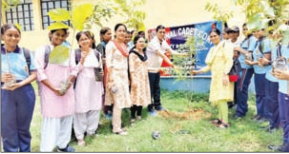
भारत सरकार के एक पेड़ माँ के नाम अभियान के तहत किया गया पौधरोपण