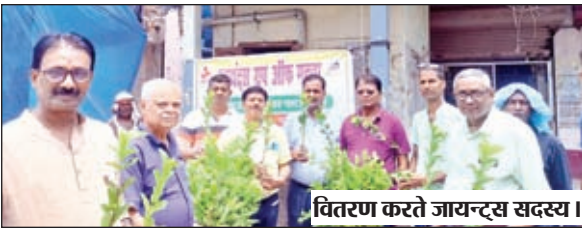
वितरण करते जायन्ट्स सदस्य।