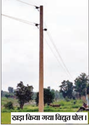
खड़ा किया गया विद्युत पोल।