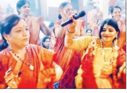
■ जुगसलाई राणी सती मंदिर में धूमधाम से मना सिंधारा-तीज उत्सव