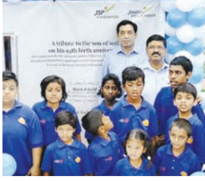
बच्चों को गिफ्ट देते अधिकारी।