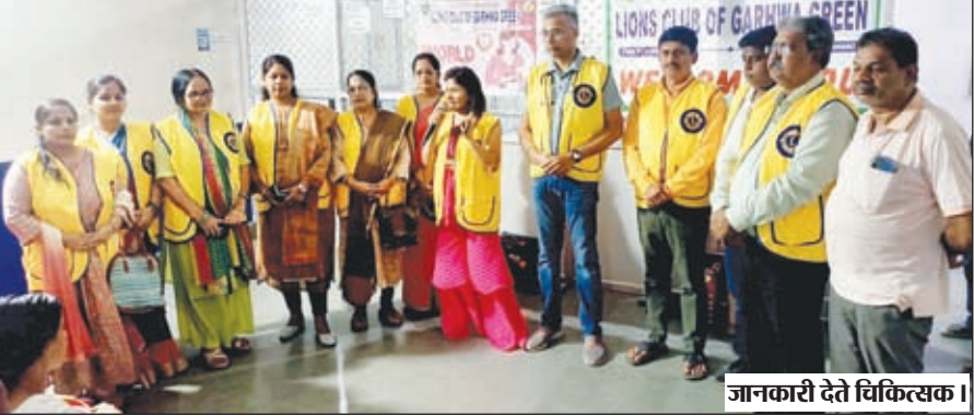
जानकारी देते चिकित्सक।

गढ़वा। लायंस क्लब ऑफ गढ़वा ग्रीन के तत्वावधान में अंतर्राष्ट्रीय स्तनपान सप्ताह के उपलक्ष्य में शहर के चिनिवां रोड स्थित परमेश्वरी मेडिकल सेंटर में जागरूकता शिविर का आयोजन किया गया। इस दौरान महिलाओं के बीच दवाइयां का भी वितरण किया गया। परमेश्वरी मेडिकल सेंटर की ओर से आयरन, कैल्शियम की दवाइयां वितरित की गईं। साथ ही मरीजों के बीच नि:शुल्क प्रोटीन पाउडर का भी