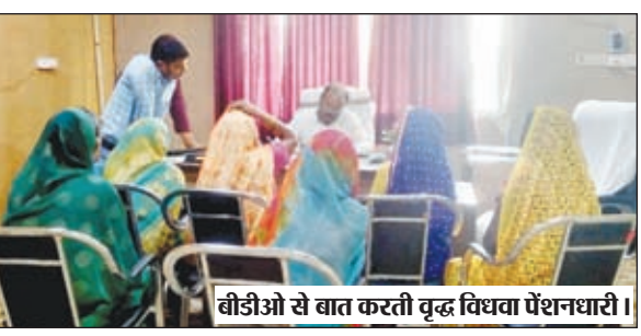
बीडीओ से बात करती वृद्ध विधवा पेंशनधारी।