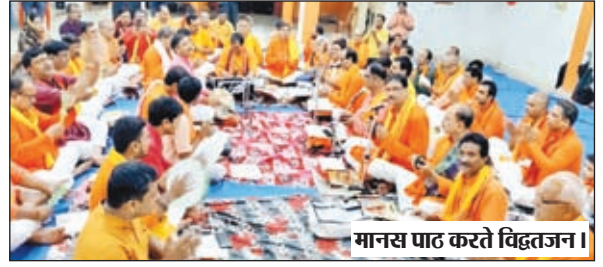
मानस पाठ करते विद्वतजन।