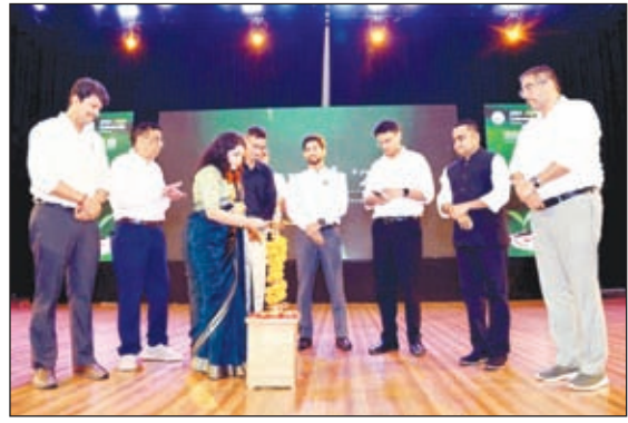
कार्यक्रम का दीप प्रज्वलित कर उद्घाटन करते अतिथिगण और रंगारंग कार्यक्रम प्रस्तुत करते छात्र-छात्राएं।

अरका जैन यूनिवर्सिटी में रंगारंग आरंभ 2024 के साथ नये सत्र का आगाज