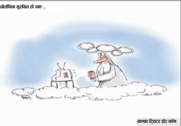
सागर दिखर इंटर कॉम