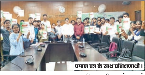
प्रमाण पत्र के साथ प्रशिक्षणार्थी।