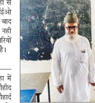
विद्यालय में शेख तौहीद

उक्त शिक्षक को उत्क्रम. मवि धंगरडीहा से स्थांतरण किए जाने संबंधी पत्र बीईईओ को अप्रेषित करने के 6 दिन बीतने के बाद भी उन्हें मूल विद्यालय से विरमित नहीं किया जाना शिक्षा विभाग के अधिकारियों पर सवालिया निशान खड़ा कर रहा है।