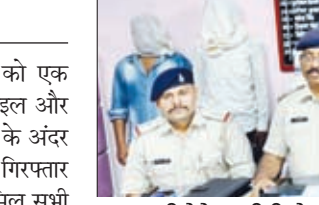
जानकारी देते एसडीपीओ