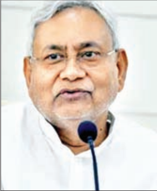
को अब टेंडर मिलेगा। कंपनी को बिहार में जीएसटी रजिस्टर्ड होना चाहिए। एल

की मंजूरी मिली है। अपर निदेशक खनिज विकास के लिए एक पद एवं उप निदेशक खनिज विभाग के लिए एक पद की प्रतिनियुक्ति के आधार पर नियुक्त किए जाने का प्रस्ताव भी कैबिनेट में पास किया गया है। इसके साथ उद्योग विभाग की ओर से हस्तकरघा एवं रेशम निदेशालय के अंतर्गत आने वाले 610 पदों को समाप्त कर दिया गया है? इसके अलावा राजपत्रित 20 नए पद एवं अराजपत्रित 116 नए पद यानी कुल 136 नए पदों के सृजन की स्वीकृति आज कैबिनेट में मिली है। दूसरी ओर बिहार सरकार ने उद्योग नीति में बदलाव किया है। बिहार की कंपनी