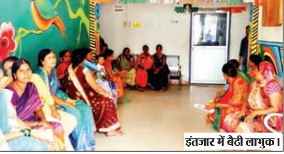
इंतजार में बैठी लाभुक।

मझिआंव। महिलाओं को सशक्तिकरण एवं सम्मान को लेकर झारखंड सरकार द्वारा संचालित मुख्यमंत्री मंडियां सम्मान निधि योजना का फॉर्म दो दिनों से ऑनलाइन नहीं हो रहा है। जिस कारण लाभुकों में निराशा है। विदित हो कि 21 वर्ष से 49 वर्ष की महिला एवं युवतियों को मुख्यमंत्री मंडियां सम्मान निधि योजना के तहत प्रत्येक माह 1000 रूपए योग्य लाभुकों के खाते में देने की बात कही गई है। जिसके लिए 3 से 10 अगस्त तक योग्य लाभुकों को संबंधित मतदान केंद्रों पर सीएसपी संचालकों के द्वारा