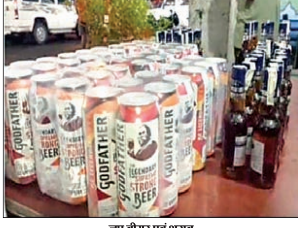
जस वीयर एवं शराब