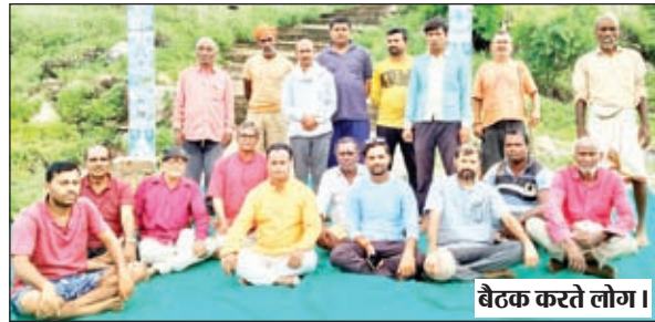
बैठक करते लोग।

जानकारी देते हुए संरक्षक ने बताया कि 12 अगस्त को शिव पहाड़ी गुफा मंदिर के तत्वावधान में चैथे सोमवारी को भव्य कावड़ यात्रा निकाला जायेगा। जो केतार प्रखंड के दादरा पांडा नदी से प्रातः 7 बजे सभी कावरियों को जल