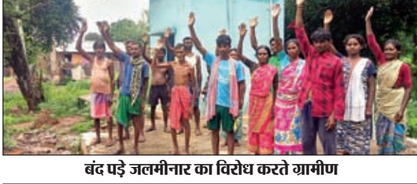
बंद पड़े जलमीनार का विरोध करते ग्रामीण

गोपीकांदर। हर घर नल और हर नल में जल केंद्र सरकार की महत्वाकांक्षी योजनाओं में से एक है। सरकार की इस महत्वाकांक्षी योजना को गोपीकांदर के सात पंचायतों में धरातल पर उतारा गया, लेकिन इस योजना का उद्देश्य विपरीत रहा। हर घर में नल तो लगी लेकिन नल में जल नहीं पहुंचता। जानकारी के मुताबिक सातों पंचायतों में योजना को पूर्ण रूप दे दिया गया, लेकिन आज भी पानी के लिए उसी जद्दोजहद लगी हुई है। इस योजना की देखरेख बगैर किसी जिम्मेदार अधिकारी के पूर्ण किया गया। पानी टंकी निर्माण से लेकर नल लगाने तक जो अनियमितता का खेल खेला गया वह सिर्फ लूट को दर्शाता है। ताजा मामला महालों गांव का है। महालों