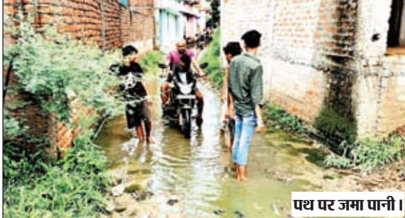
पथ पर जमा पानी।

मझिआंव। नगर पंचायत के पदाधिकारियों के उदासीन रवैया के कारण ब्लॉक रोड शिव मंदिर के समीप स्थित वार्ड नंबर 3 सेवानिवृत्त एसआई बेचने राम गली के लोग नारकीय जिंदगी जीने को विवस है। पीसीसी पथ का निर्माण तो लगभग 8 वर्ष पूर्व हो चुका है, पर मुख्य सड़क के किनारे बने नाली के ऊंचाई होने के कारण गली के पानी की निकासी नहीं हो पाती। जिस कारण पीसीसी पथ पर डेढ़ से 2 फीट कीचड़नुमा पानी जमा हो जाता है। इसके साथ-साथ अभी बारिश के दिन में यहां के लोगों