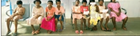
इलाज के लिए अस्पताल पहुंचे बच्चे