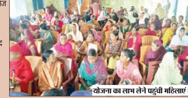
योजना का लाभ लेने पहुंची महिलाएं।