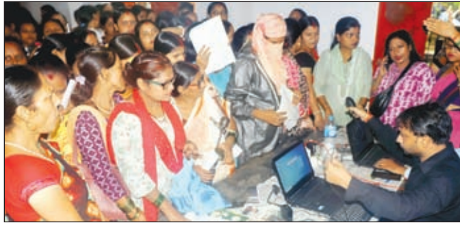
पंडित दीनदयालय उपाध्याय भवन, साकची में लगे विशेष कैंप में पंजीयन करने उमड़ी महिलाओं की भीड़।