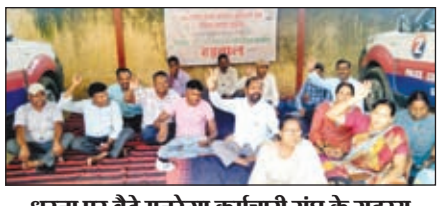
धरना पर बैठे मनरेगा कर्मचारी संघ के सदस्य