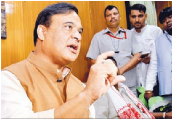
सर्किट हाउस में पत्रकारों से बात करते हेमंत बिस्वा।

■ भाजपा का मुद्दा विधायक जिताना नहीं बल्कि झारखंड को बचाने का है ■ भाजपा की सरकार बनने पर झारखंड से बांग्लादेशी घुसपैठियों को मगायेंगे ■ झारखंड सरकार लिख कर दे दें कि राज्य से घुसपैठियों को मगाने की जिम्मेवारी केंद्र सरकार की है, हम विचार करेंगे