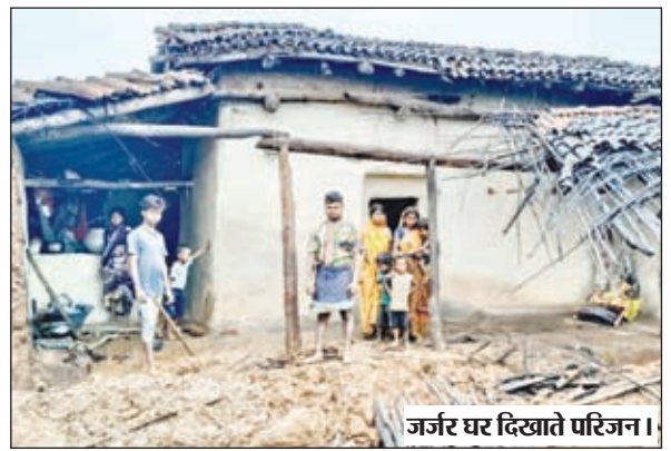
जर्जर घर दिखाते परिजन।