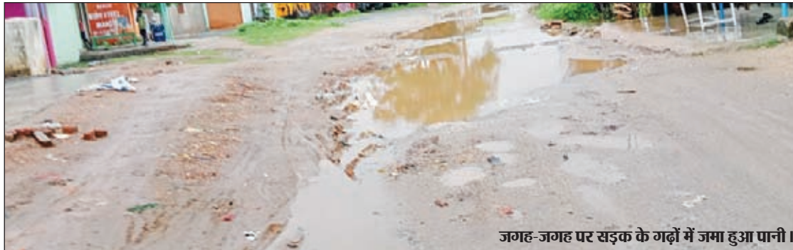
जगह-जगह पर सड़क के गढ़ों में जमा हुआ पानी।

मनिका। मनिका प्रखंड मुख्यालय के पंचफेड़ी चौक से होते हुए पांकी जाने वाली सड़क की स्थिति इन दिनों काफी जर्जर हो गई है। इस सड़क की स्थिति इतनी दयनीय है कि वाहन चलाना तो दूर की बात लोगों को पैदल चलना भी काफी मुश्किल हो गया है। सड़क में जगह-जगह पर बड़ा-बड़ा गड्ढा