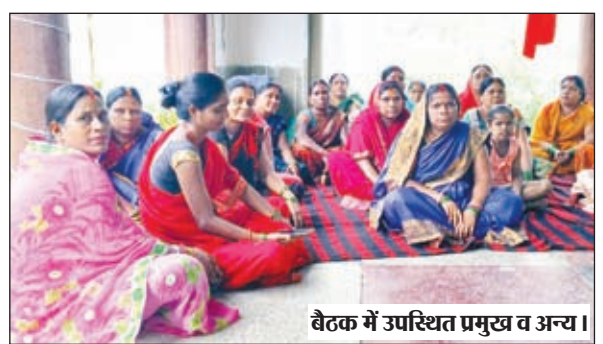
बैठक में उपस्थित प्रमुख व अन्य।