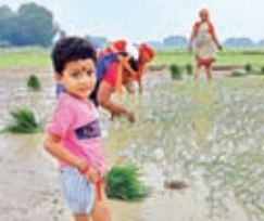
धान रोपनी करते लोग

भंडरा। एक अगस्त की रात से लगातार हो रही बारिश से जन जीवन प्रभावित हो गया है खेत खलिहान तालाब कुआ नदी सभी जगह जलस्तर बढ़ गया है। लगातार हो रही मूसलाधार बारिश के कारण चौक चौराहे सड़क में लोगों का आवागमन बंद है कार्यालय बैंक स्कूल में लोगों की उपस्थिति नहीं के बराबर है। प्रखंड क्षेत्र में लंबे समय से बारिश