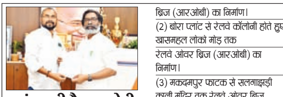
यहां बनी है आरओवी