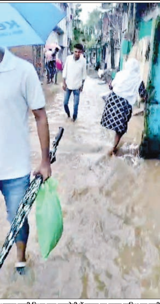
आजाद बस्ती स्थित रजा कालोनी में सड़क पर बहता बारिश का पानी

खबर मन्त्र संवाददाता से जनजीवन अस्त-व्यस्त हो गया है। मौसम विभाग की मांनें तो 3 अगस्त को भी बारिश होगी। इधर लगातार बारिश से शहर के कई