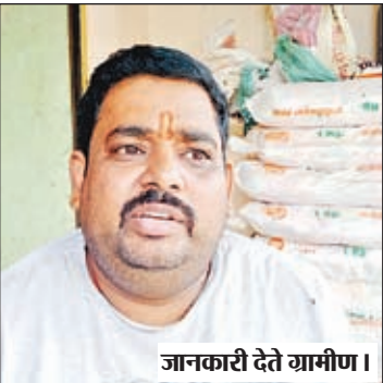
जानकारी देते यामीण।