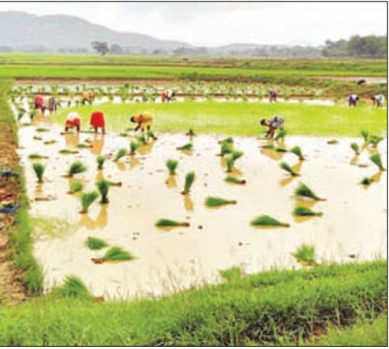
खेत में धनरोपनी करती महिलाएं