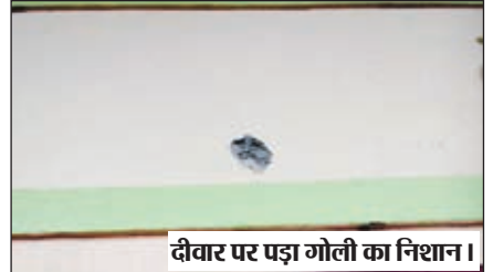
देवार पर पड़ा गोली का निशान।