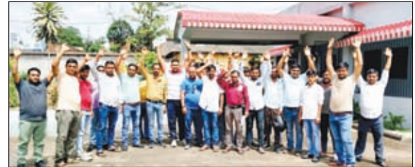
खबर मन्त्र संवाददाता

सिमरिया। चतरा के सिमरिया, टंडवा और केरेडारी हाड़वा ऑनर