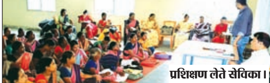
प्रशिक्षण लेते सेविका।