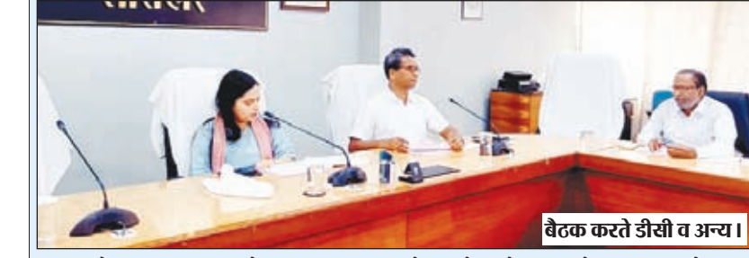
बैठक करते डीसी व अन्य।

उपायुक्त के द्वारा आईटीडीए से संचालित अन्य योजनाओं की समीक्षा की गई एवं सभी योजनाओं का लाभ सुयोग्य लाभुकों को मिले इसे सुनिश्चित करने का निर्देश दिया गया। उन्होंने कहा कि कल्याण विभाग एवं आईटीडीए से संचालित