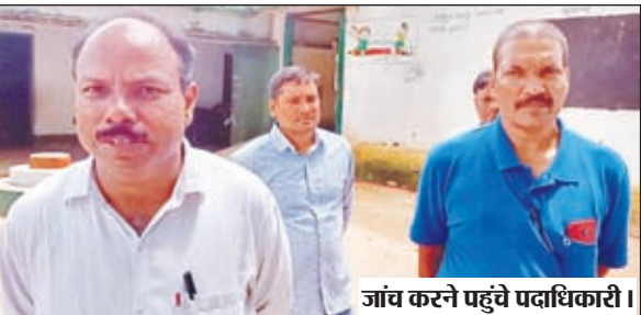
जांच करने पहुंचे पदाधिकारी।