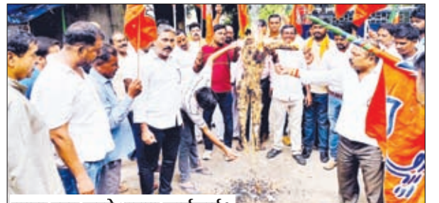
पुतला दहन करते भाजपा कार्यकर्ता।