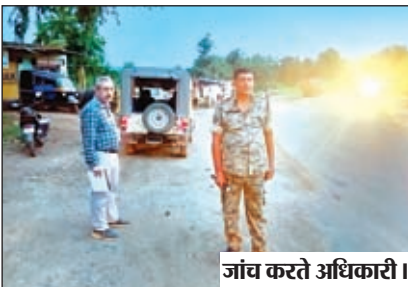
जांच करते अधिकारी।