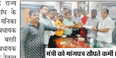
मंत्री को मांगपत्र सौंपते कर्मी।