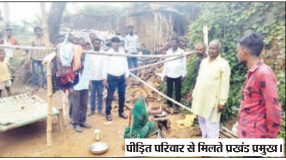
पीड़ित परिवार से मिलते प्रखंड प्रमुख।