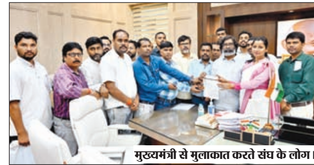
मुख्यमंत्री से मुलाकात करते संघ के लोग।