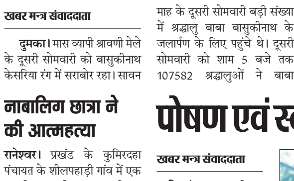
खबर मन्त्र संवाददाता

दुमका। मास व्यापी श्रावणी मेले के दूसरी सोमवारी को बासुकीनाथ केसरिया रंग में सराबोर रहा। सावन