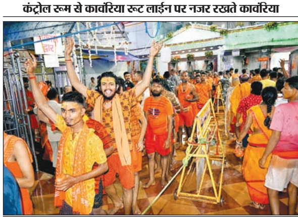
कंट्रोल रूम से कांवरिया रूट लाईन पर नजर रखते कांवरिया