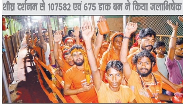
राष्ट्र दर्शन से 107582 एवं 675 डाक बम ने किया जलाभिषेक