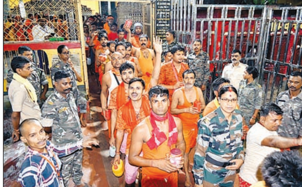
नारा लगाते कांवरिया