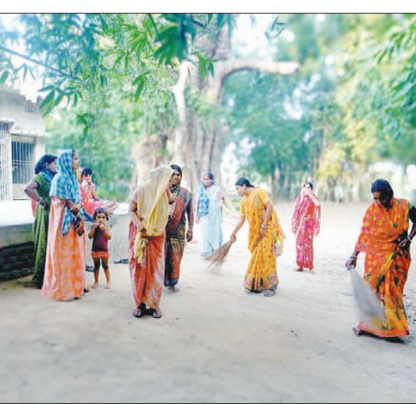
एनीमिया, ग्राम स्वास्थ्य पोषण दिवस के दिन मिलने वाली सभी सेवाएं,