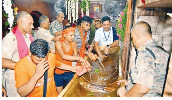
जलाभिषेक करते कांवरिया

वासुकीनाथ धाम केसरिया रंग से हुआ सराबोर, हर हर महादेव के जयकारों से गुंजा फौजदारी दरवार, कांवरिया रूट लाईन पर डीसी की रही पैनी नजर