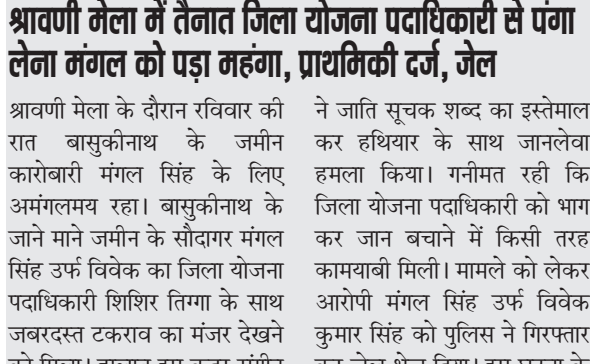
श्रावणी मेला में तैनात जिला योजना पदाधिकारी से पंगा लेना मंगल को पड़ा महंगा, प्राथमिकी दर्ज, जेल