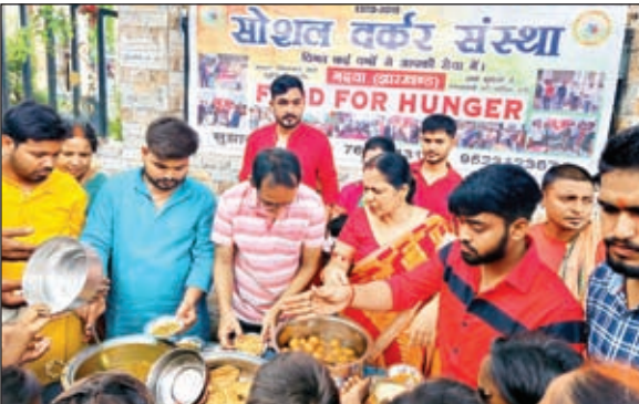
वितरण करते संस्था के सदस्य