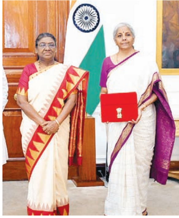
राष्ट्रपति द्रौपदी मुर्मू को बजट की प्रति सौंपती वित्त मंत्री सीतारमण।

सीतारमण ने कहा कि बिहार में अक्सर बाढ़ आती रहती है। नेपाल में बाढ़ नियंत्रण संरचनाओं के निर्माण की योजना अभी तक आगे नहीं बढ़ पाई है। हमारी सरकार 11,500 करोड़ रुपये की अनुमानित लागत से वित्तीय सहायता प्रदान करेगी। उन्होंने कहा कि असम जो हर