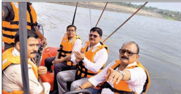
बोटिंग करते मंत्री, जिप अध्यक्ष, डीसी, एसपी, डीडीसी