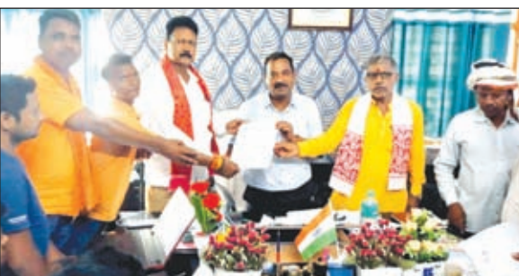
मांग पत्र सौंपते भाजपाई