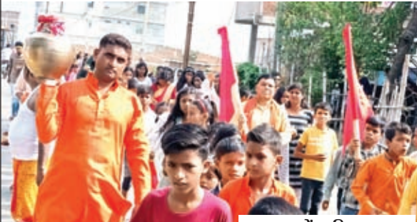
जल यात्रा में शामिल श्रद्धालु।