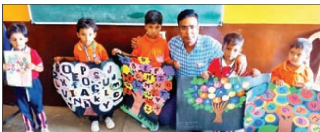
निदेशक के साथ अल्फाबेट प्रोजेक्ट वर्क में शामिल नन्हे-मुन्हे बच्चे