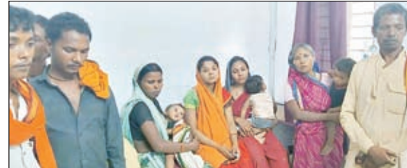
अनुसूचित जनजाति परिवार