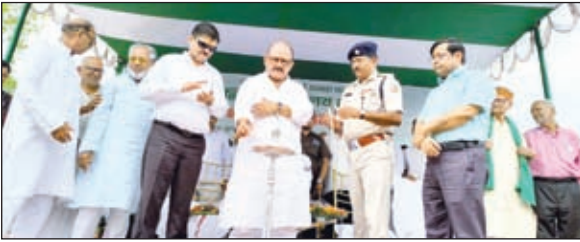
पूजा अर्चना कर भूमि पूजन करते मंत्री