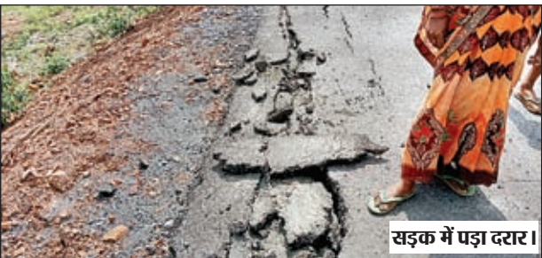
सड़क में पड़ा दरार।