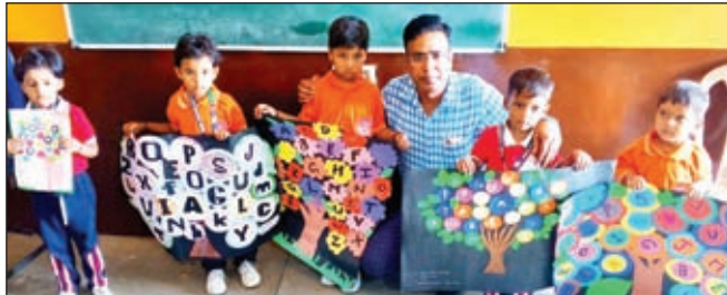
निदेशक के साथ अल्फाबेट प्रोजेक्ट वर्क में शामिल नन्हे-मुन्हे बच्चे