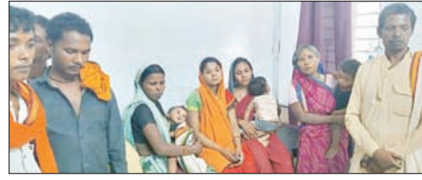
अनुसूचित जनजाति परिवार