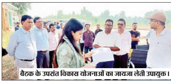
बैठक के उपरांत विकास योजनाओं का जायजा लेती उपायुक्त।

सरकार की महत्वकांक्षी योजनाओं में से एक है। ऐसे में सभी पंचायतों में स्थल चयन करते हुए वीर शहीद पोटा हो खेल विकास योजना के तहत कराये जाने वाले कार्यों को ससमय पूर्ण करें। बैठक में मनरेगा अंतर्गत संचालित योजनाओं की बिंदुवार समीक्षा के क्रम में बिरसा सिंचाई कूप संवर्द्धन योजना की स्वीकृति, आधार सीडिंग, पीडी जेनरेशन, रिजेक्शन ट्रांजैक्शन इत्यादि को लक्ष्य के अनुरूप कार्य करते हुए गति के साथ शत-प्रतिशत