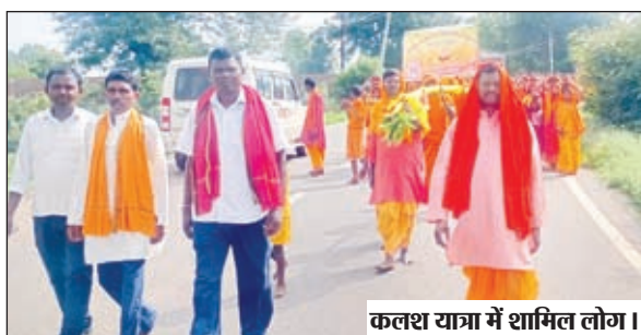
कलश यात्रा में शामिल लोग।

बरवाडीह। बरवाडीह के पैरा में बाबा विश्वनाथ मंदिर की 17 वीं स्थापना दिवस के मौके पर शनिवार को संत कबीर तुलसी सेवा आश्रम की ओर से भव्य व विशाल कलश यात्रा निकाली गई। कलश यात्रा पैरा से निकलकर बरवाडीह प्रखण्ड मुख्यालय के कुसामाही नदी से पवित्र जल भरकर विभिन्न मार्ग होते हुए प्रभ्रमण किया। जिसके बाद श्रद्धालु वापस मंदिर में पहुंचे। मंदिर की चारों ओर परिक्रमा किया गया और कलश के पवित्र जल से वैदिक मंत्रोच्चारण के साथ भगवान शंकर का जलाभिषेक किया गया। कलश