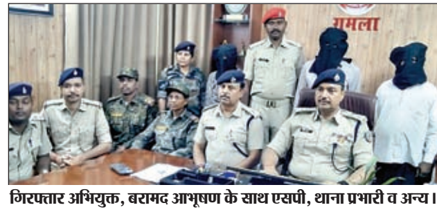
गिरफ्तार अभियुक्त, बरामद आभूषण के साथ एसपी, थाना प्रभारी व अन्य।