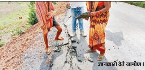
जानकारी देते ग्रामीण।

दुर्दशा काफी खराब हो गई है, जगह-जगह पर सड़क में दरार पड़ गए हैं स्थिति ऐसी है कि लोगों के हाथ से ही सड़क उखड़ जा रहा है। वहीं गांव के ग्रामीण बताते हैं कि सड़क निर्माण के समय हम लोग संवेदक को कई बार बोले की गुणवत्तापूर्ण काम करवाए लेकिन संवेदक अपने मनमानी तरीके से ही सड़क का निर्माण करवाया जिससे कि कुछ महीनों में ही इस सड़क में जगह-जगह पर दरार पड़ गए। ग्रामीणों ने कहा कि अगर सड़क का निर्माण गुणवत्तापूर्ण