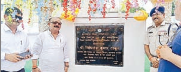
शिलापट्ट का अनावरण करते मंत्री