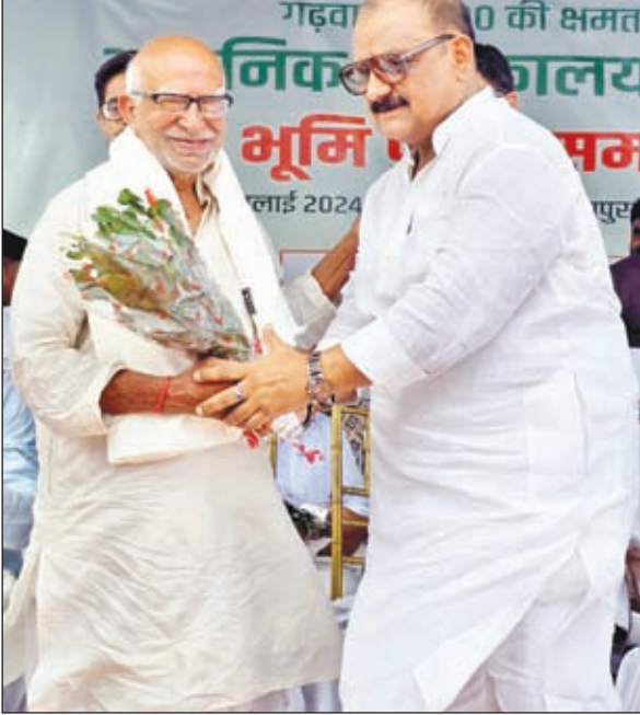
सम्मानित करते मंत्री