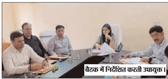
बैठक में निर्देशित करती उपायुक्त।

लेते हुए आवश्यक व उचित दिशा निर्देश दिया गया। इस दौरान उपायुक्त ने मनिका प्रखंड के सभी पंचायतों में चल रहे कार्य प्रगति की क्रमवार जानकारी ली और लक्ष्य के अनुरूप कार्य करने को कहा। इस दौरान बिरसा हरित ग्राम योजना के तहत अब तक मनिका प्रखंड अंतर्गत कार्यान्वित की गई प्रगति की समीक्षा करते हुए लक्ष्य की शत-प्रतिशत उपलब्धि प्राप्त करने का निर्देश दिया गया। वीर शहीद पोटा हो खेल विकास योजना की समीक्षा के क्रम में पाया गया कि योजना के तहत दो चरण (फेज) में मनिका प्रखंड में कुल 52 खेल मैदानों के विकास का लक्ष्य प्राप्त है। जिसके विरुद्ध 16 को पूर्ण कर लिया गया है। इस पर उपायुक्त द्वारा रोप प्रकट करते हुए प्रखंड विकास पदाधिकारी मनिका को निर्देशित करते हुए कहा गया कि राज्य