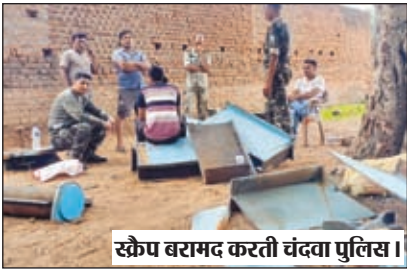
स्क्रैप बरामद करती चंदवा पुलिस।

चंदवा। लातेहार एसपी अंजनी अंजनी को मिली गुप्त सूचना के आधार पर चंदवा