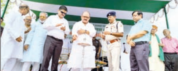
पूजा अर्चना कर भूमि पूजन करते मंत्री