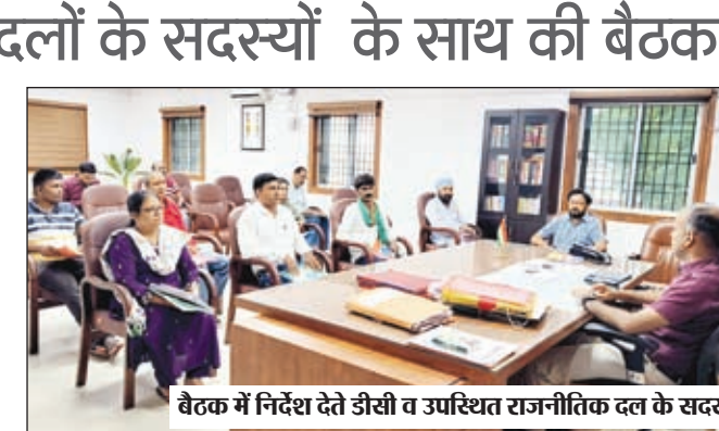
बैठक में निर्देश देते डीसी व उपस्थित राजनीतिक दल के सदस्य।