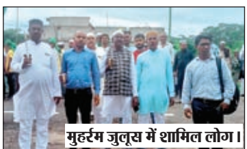
मुहर्रम जुलूस में शामिल लोग।

जारी। जारी थाना क्षेत्र के सिकरी, जरडा, परसा, गोविंदपुर आदि मुस्लिम गाँवों में बुधवार को मुहर्रम का पर्व शांतिपूर्ण तरीके से मनाया गया। इस दौरान नारे