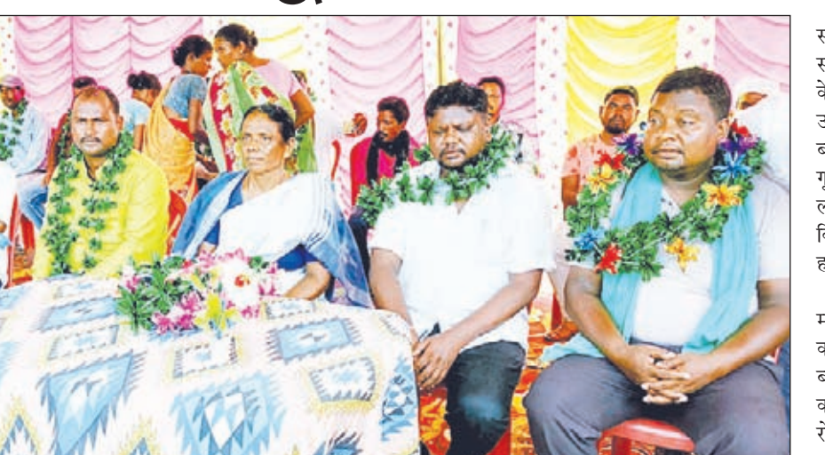
कार्यक्रम के दौरान मंच पर उपस्थित सांसद जोबा माझी व अन्य।

खबर मन्त्र प्रतिनिधि सोनूवा। सिंहभूम को सांसद जोबा माझी सोमवार को गुदड़ी प्रखंड के टोमडेल पंचायत के गितिलउली गांव पहुंचीं। जहां ग्रामीणों सहित इंडिया महागठबंधन के नेताओं ने स्कूल मैदान में आयोजित कार्यक्रम में सांसद का पारंपरिक तरीके से स्वागत करते हुए सांसद चुने जाने पर अभिनंदन किया। बारिश के बीच ग्रामीणों को संबोधित करते हुए जोबा माझी ने कहा कि जल, जंगल और जमीन और जंगल में बसे ग्रामीणों के मौलिक अधिकारों के लिए