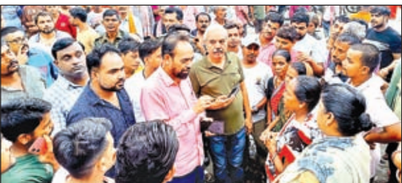
बस्तीवासियों से बात करते सांसद विद्युतवरण महतो।