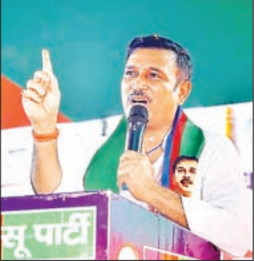
सम्मेलन को संबोधित करते अध्यक्ष सुदेश महतो और कार्यक्रम में उपस्थित आजसू समर्थक।

चांडिल। राज्य की खोयी अस्मिता को लौटाने और जनता के साथ विश्वास के संबंध को मजबूत बनाना ही हमारा राजनीतिक दायित्व है। आजसू पार्टी के एक-एक कार्यकर्ता अपने दायित्वों के निर्वहन में दिन-रात मेहनत करें। उक्त बातें आजसू पार्टी सुप्रियो सुदेश कुमार महतो ने चांडिल के बाहुडीह में आयोजित इंचागढ़ विधानसभा स्तरीय चूल्हा प्रमुख सम्मेलन सह शपथ ग्रहण समारोह में कही। मौके पर उपस्थित सभी