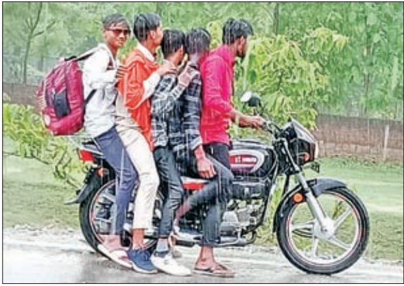
बाईक पर बैठे पांच लोग

मझिआंव। थाना क्षेत्र में बाइक सवार अपनी अनमोल जिंदगी को हथेली में लेकर और परिवहन नियम एवं पुलिस प्रशासन को ठेंगा दिखाते हुए रविवार को रिम्झीम वर्षा के दौरान एक बाईक पर पांच लोग सवार होकर अपने घर जा रहे थे। यह वाक्या मझिआंव-बरडीहा मुख्य सड़क का है। उस दौरान लोगों से पूछा गया तो उन लोगों ने ना ही अपना नाम और घर नहीं बताया।