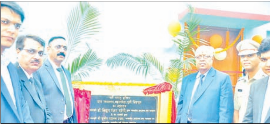
ग्राम न्यायालय का उद्घाटन करते मुख्य न्यायाधीश न्यायमूर्ति डा. बिद्युत रंजन षाडंगी। साथ में न्यायमूर्ति सुजीत प्रसाद और प्रधान जिला न्यायाधीश अनिल कुमार मिश्रा।

न्यायमूर्ति डॉ बिद्युत रंजन परंगी ने कहा कि ग्राम न्यायालय का उद्घाटन आम जनता को त्वरित न्याय उपलब्ध कराने की दिशा में एक कदम है। उन्होंने कहा कि इस व्यवस्था को लागू करने का मुख्य उद्देश्य यहां के ग्रामीण क्षेत्रों में रह रहे नागरिकों को स्थानीय स्तर पर संवैधानिक प्रक्रिया के