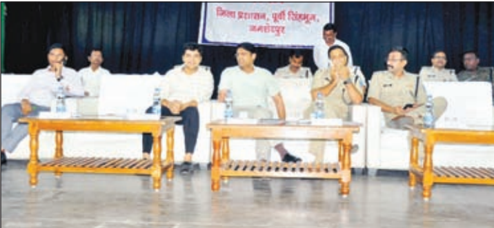
का विचलन नहीं करें, जिस मार्ग से जुलूस निकलता रहा है उसी से निकालें। प्रशासन एवं पुलिस के पदाधिकारियों को निर्देश दिया गया कि जिस मार्ग से मुहर्रम का जुलूस निकाला जाएगा, उसका पूर्व में सत्यापन कर लें। जिले में शांति एवं

शांति समिति बैठकों के फीडबैक पर चर्चा की गयी तथा मुहर्रम समिति के लाइसेंस धारियों द्वारा पेयजल, बिजली तथा अन्य मूलभूत सुविधाओं की समस्याओं को सहानुभूतिपूर्वक सुनते हुए उचित कार्रवाई को लेकर आश्चर्य