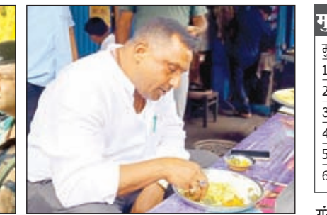
का निरीक्षण कर लोगों से मिलता भी हूँ और ऑन स्पॉट समस्या को सुनकर समाधान करने का प्रयास करता हूँ। आज कई योजनाओं का शिलान्यास कर जनता को समर्पित किया हूँ ताकि क्षेत्र में विकास की

परिवहन मद अन्तर्गत कुल योजनाओं की संख्या 24 कुल प्राक्कलित राशि - 2,87,53,168.00 है। अमृत 20 मद अन्तर्गत कुल योजनाओं की संख्या 01 कुल प्राक्कलित राशि