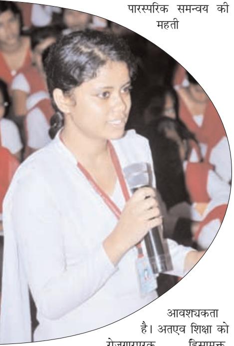
आवश्यकता है। अतएव शिक्षा को रोजगारपरक, हिंसा मुक्त, क्रियाशील, मूल्यपरक एवं प्रकृति से सम्बन्धित करके ही निर्भय, स्वानुशासित, अहिंसात्मक जीवन ढंढे वाले, आत्मनिर्भर, सहकारप्रिय एवं गीता में विंगत 'आत्मन्येवात्मना तुष्ट' (अपने भीतर स्वयं से तृप्त) युवाओं का निर्माण किया जा सकता है। ऐसे युवकों के द्वारा ही देश में सामाजिक सौहार्द, सुख-शान्ति व समृद्धशाली समाज की स्थापना की जा सकती है जिसके द्वारा ही आधुनिक सभ्यता के उज्ज्वल भविष्य का सपना साकार हो सकेगा।

समाज और राष्ट्र के बिखरे हुए ऊर्जा के स्रोत युवाओं को संगठित और अनुशासित करके उनकी ऊर्जा को किसी सकारात्मक लक्ष्य और समाज उत्थान के कार्य हेतु अगर प्रयोग में लिया गया तो यह युवा शक्ति हर लक्ष्य को भेदती हुई सफलता के नए आयाम गढ़कर देश और समाज को हिमालय की बुलंदियों तक पहुंचा सकेगा। इसके लिए उचित शिक्षा, सही मार्गदर्शन एवं अभिभावक, शिक्षक, सामाजिक कार्यकर्ताओं व सरकारी तंत्र के पारस्परिक समन्वय की महती