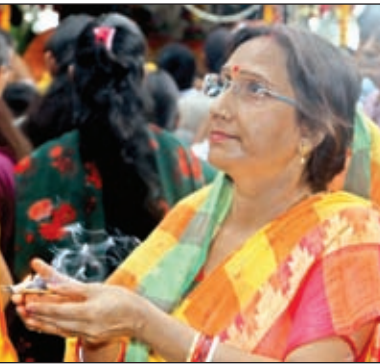
बेल्डीह में प्रभु जगन्नाथ की आरती करती महिला