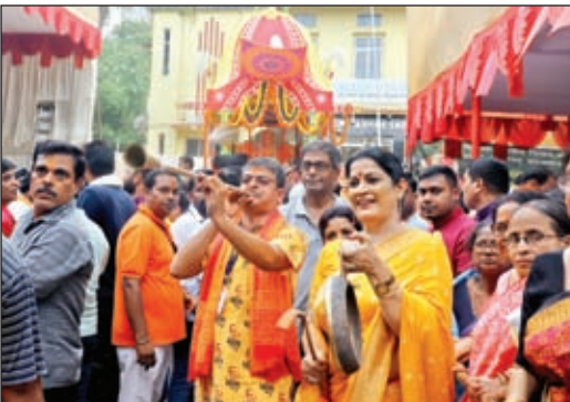
उत्कल एसो में प्रभु के रथ के आगे जयघोष करता कलाकार।