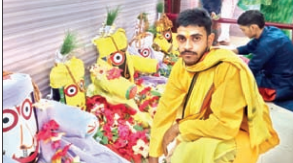
पूजा अर्चना करते पुरोहित

भंडरा। भंडरा प्रखंड में नौ दिवसीय ऐतिहासिक रथ यात्रा सह मेला में भक्तों का सैलाब उमड़ पड़ा। भगवान के दर्शन को लेकर भक्तों की कतार अहले सुबह से ही ठाकुरबाड़ी मंदिर में जुटनी शुरू हो गई थी। जय-जय जगन्नाथ के जयकारे से पूरा वातावरण भक्तिमय हो गया। लोगों में भगवान के दर्शन और रथ खींचने को लेकर एक प्रतिस्पर्धा नजर आई।