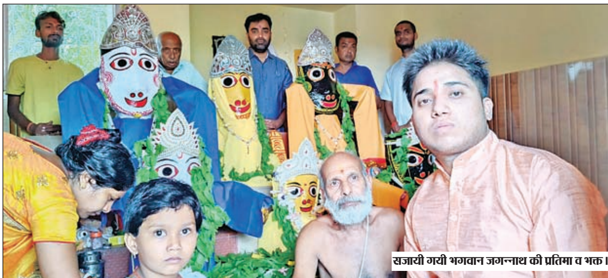
सजायी गयी भगवान जगन्नाथ की प्रतिमा व भक्त ।

राज पुरोहितो व श्रद्धालुओं ने भगवान जगन्नाथ का रथ खिंच मांगा क्षेत्र की खुशहाली का आशीर्वाद