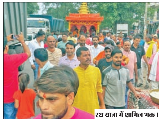
रथ यात्रा में शामिल भक्त ।

बालूमाथ। बालूमाथ महावीर मंदिर परिसर से रविवार को भव्य रथ शोभायात्रा निकाली गई। सैकड़ों श्रद्धालु भगवान जगन्नाथ, देवी सुभद्रा एवं भगवान बलभद्र के मूर्ति को रथ में सजाकर बैड बाजे की धुन पर एक भव्य शोभा यात्रा निकाली गई। शोभायात्रा महावीर मंदिर