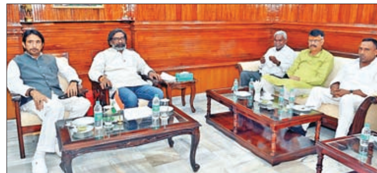
खबर मन्त्र ब्यूरो