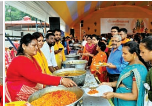
अंतिम दिन भोग ग्रहण करते भक्तजन।

हूए। इन पांच दिनों में महायज्ञ परिसर का पूरा वातावरण भक्तिमय हो गया था। मंदिर परिसर में एक यज्ञवेदी बनाया गया था। समस्त धार्मिक अनुष्ठान वहीं संपन्न हुए। इस यज्ञ वेदी के ठीक बगल