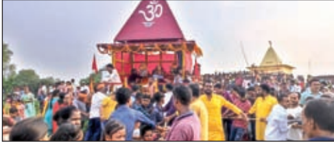
भगवान जगन्नाथ की पूजा अर्चना करते लोग, रथ मेला में पहुंचे लोग, भगवान जगन्नाथ के रथ को खींचकर मौसी बाड़ी ले जाते लोग

खबर मन्त्र संवाददाता गुमला। गुमला जिला के विभिन्न स्थानों पर सोमवार को रथ यात्रा सह मेला का आयोजन किया गया। रथ में भगवान जगन्नाथ, बहन सुभद्रा व भाई बलराम को धार्मिक अनुष्ठान के साथ स्थापित कर मौसी बाड़ी पहुंचाया गया। सोमवार की अहले सुबह से ही करौंदी व नागफेनी मंदिर में भगवान जगन्नाथ