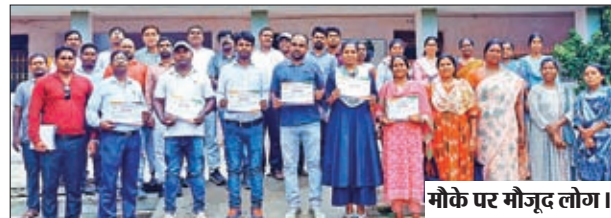
मौके पर मौजूद लोग ।