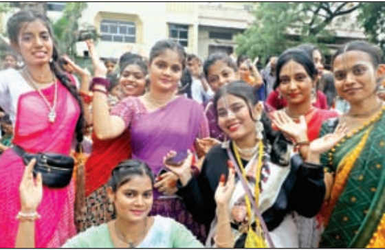
रथयात्रा में उत्साहित युवतियां।