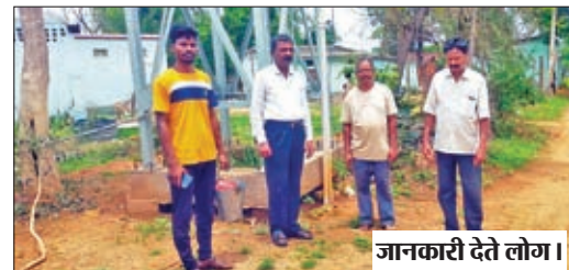
जानकारी देते लोग ।

अम्बादोहर में दिखावे की वस्तु बनी नलजल योजना, नहीं पहुंच रहा घर घर में पानी