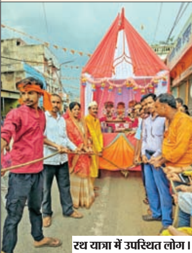
रथ यात्रा में उपस्थित लोग ।