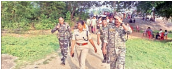
रथ मेला के दौरान सुरक्षा का जायजा लेती एसडीपीओ चैनपुर व अन्य