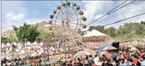
मेले में उमड़ी भीड़

संख्या मे भक्त भगवान का रथ खींचकर सुख-शांति और समृद्धि की कामना की। ऐतिहासिक रथ यात्रा सह मेला को लेकर सुरक्षा के व्यापक इंतजाम किए गए थे। लोग प्रभु के दर्शन को लेकर लीन नजर आए। महिला-पुरुष, बच्चे और युवा भगवान के दर्शन को आतुर नजर आए। सभी भगवान से अपनी सुख-समृद्धि और