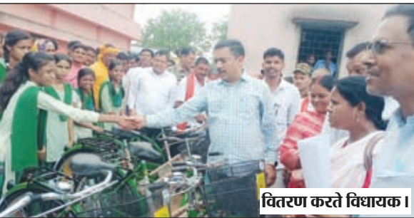
वितरण करते विधायक।