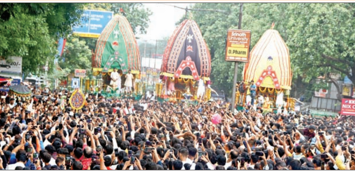
श्रीराममंदिरम से तीन विशाल रथों पर सवार होकर प्रभु जगन्नाथ, बहन सुभद्रा और बलराम जी।

सुभद्रा के रथ बिष्टुपुर डैगनल रोड होते हुए पोस्टल पार्क और वहां से नुस्को गोलचक्रर होते हुए कनिन स्टैडियम वाले स्ट्रेट माइल