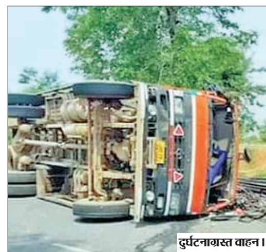
दुर्घटनाग्रस्त वाहन ।

मनिका थाना क्षेत्र के डिग्री कॉलेज के समीप असंतुलित होकर ट्रक हुआ दुर्घटनाग्रस्त