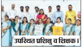
उपस्थित प्रशिक्षु व शिक्षक।