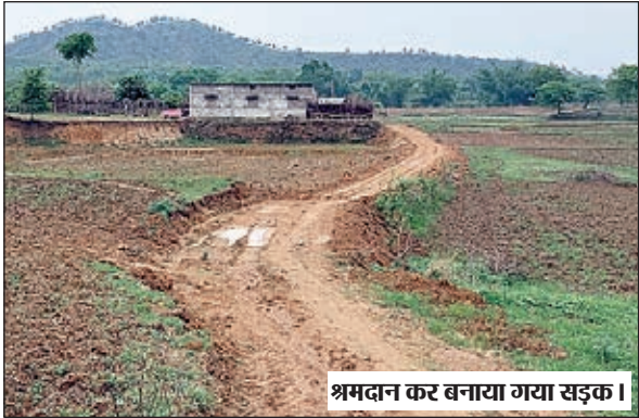
श्रमदान कर बनाया गया सड़क।