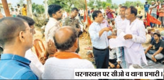
धरनास्थल पर सीओ व थाना प्रभारी।