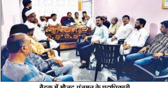
बैठक में मौजूद अंजुमन के पदाधिकारी