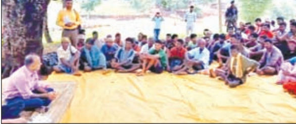
ग्रामीणों के साथ बैठक करते उपायुक्त