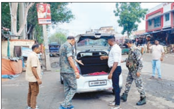
वाहन जांच करती पुलिस