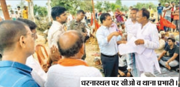
धरनास्थल पर सीओ व थाना प्रभारी।