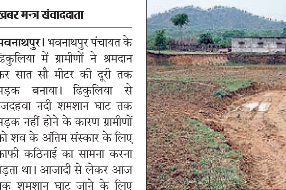
श्रमदान कर बनाया गया सड़क।

अंतिम संस्कार के लिए रजदहवा नदी शमशान घाट पर ले जाते हैं। शमशान घाट तक जाने के लिए पगडंडी का सहारा लेना पड़ता था। किसी भी जनप्रतिनिधि ने इस समस्या का समाधान नहीं किया। बताया कि हम सभी ग्रामीणों ने भूस्वामी से सड़क बनाने के लिए जमीन देने का आग्रह किया, जिस पर सहर्ष स्वीकार करते हुए सड़क