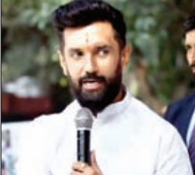
एनडीए के राष्ट्रीय अध्यक्ष चिराग पासवान ने अपने पिता व पूर्व केंद्रीय मंत्री दिवंगत रामविलास पासवान की 78वां जयंती शुक्रवार को समारोहपूर्वक हाजीपुर पासवान चौक स्मारक स्थित मनाई। कार्यक्रम में हाजीपुर सांसद सह केंद्रीय मंत्री चिराग पासवान अपने पिता दिवंगत रामविलास पासवान की आदमक़ाद प्रतिमा पर माल्यार्पण और पुष्प अर्पित कर आशीर्वाद लिया है। इसके साथ ही अपने पिता के बताए