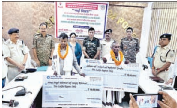
आत्मसमर्पण करते माओवादी

जायेंगी। आज उन्हें दस-दस लाख रुपए का प्रतीकात्मक चेक सौंपा गया है। शीघ्र ही अन्य सुविधायें भी प्रदान की जायेंगी। उन्होंने अन्य उग्रवादी व माओवादियों से इस नीति का लाभ उठाने की अपील की।