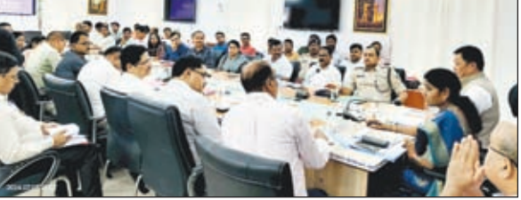
बैठक में निर्देश देते अनुसूचित जनजाति आयोग के सदस्य