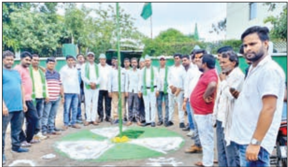
स्थापना दिवस मनाते राजद कार्यकर्ता