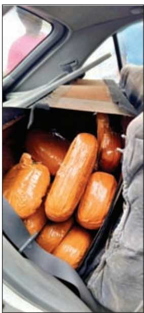
वाहन में लोड गांजा

में लगभग 21 किलो गांजा बरामद किया, जिसे मजिस्ट्रेट की मौजूदगी में सील करते हुए अग्रतर कार्रवाई में जुट गयी है। इधर इस दुर्घटना के बाद एनएच के रास्ते होने वाले मादक पदार्थ गांजा की तस्करी का खेल भी उजागर हो गया है। अगर तस्करी की किस्मत खराब नहीं होती व दुर्घटना नहीं हुआ होता तो तस्करी आराम से गांजा लेकर अपने निकल जाते। तस्करी के हिम्मत का अंदाज