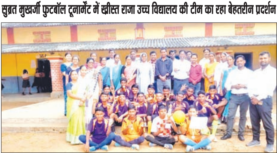
लोगों में खुशी