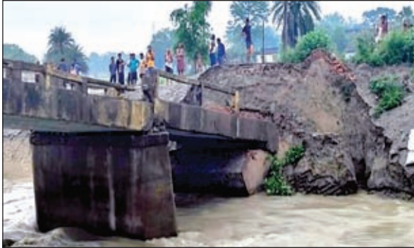
धमई नदी पर 90 के दशक में बनी पुलिया क्षतिग्रस्त हो गई है। इससे सिकंदरपुर गांव का संपर्क प्रखंड व अनुमंडल मुख्यालय से पूरी तरह

या दो नहीं एक साथ अलग-अलग जगहों पर तीन पुलिया धंस गई हैं। पुलिया के धंस जाने से दो दर्जन से अधिक गांवों के लोगों का आवागमन ठप हो गया। पुल - पुलिया के ध्वस्त होने से जो जहां था, वहीं रुक गया है। पुलिया के ध्वस्त होने का पहला मामला देवरिया पंचायत के पराईन टोला का है। जहां महाराजगंज-दरौदा प्रखंड के साथ देवरिया व रामगाढ़ा पंचायत को जोड़ने वाला गंडकी नदी पर 2004 में बनी पुलिया ध्वस्त हो गई। वहीं, तेवथा पंचायत में नौतन व सिकंदरपुर गांव के बीच