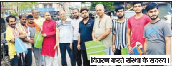
वितरण करते संस्था के सदस्य।