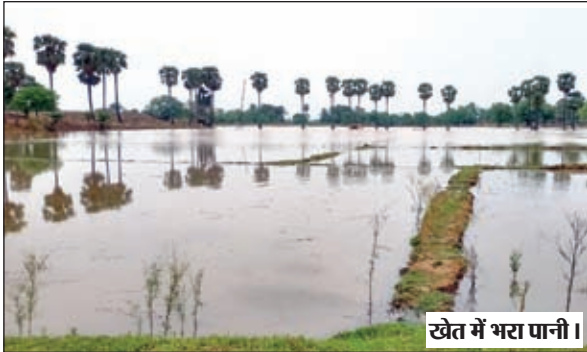
खेत में भर पानी।

कांडी। भीम बराज की बावियां मुख्य नहर में पानी आते ही नहर का बांध टूटने से दो गांवों का 22 एकड़ खेत डूबा था। ऊपर से फाटक खोलकर और पानी छोड़ दिया गया। जिसका नतीजा हुआ कि और अधिक खेतों में पानी भर गया। एक अनुमान के अनुसार भंडरिया गांव के 4 एकड़ एवं मोरबे गांव के और 3 एकड़ खेतों में पानी भर गया। इस प्रकार करीब 29 एकड़ खेत जलमग्न हो गया है। किसानों ने कहा कि उनके लिए यह भारी विपत्ति आ गई है। धान का बीज डालने का समय निकला जा रहा है। दो गांव के खेत में पानी भरने से बीज नहीं डाला जा सकता है। जबकि भंडरिया से नीचे दर्जन भर गांव है जहां इसी