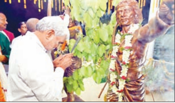
कुलडीहा में अमर शहीद सिदो-कान्हू की प्रतिमा का अनावरण करने के बाद नमन करते मुख्यमंत्री चंपई सोरेन।

मुख्यमंत्री ने कहा कि जनता के हित में राज्य सरकार कई नई योजनाओं को लेकर आ रही है। आने वाले 1 से 2 महीने में इन योजनाओं के माध्यम से यहां की लोगों को हम सशक्त बनायेंगे। सीएम ने कहा कि अब राज्य के लोगों को 200 यूनिट बिजली मुफ्त में मिलेगी तो 25 से 50 वर्ष तक की बहन-बेटियों को आर्थिक सहायता देने जा रही है। स्वास्थ्य सुरक्षा योजना के तहत राशन कार्डधारियों को 15 लाख तक के इलाज का खर्च