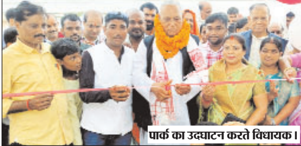
पार्क का उद्घाटन करते विधायक।