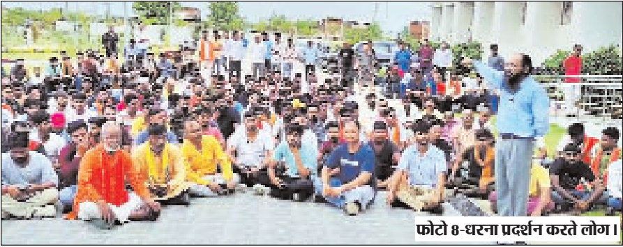
फोटो 8- धरना प्रदर्शन करते लोग।

गढ़वा। जिला मुख्यालय के मझिआंव मोड़ के निकट उसं की रात एक विशेष समुदाय के कुछ मनबढ़े युवकों द्वारा जुलूस के दौरान एक पशु पर तलवार से हमला कर दिये जाने का मामला प्रकाष में आया है। मौके पर मौजूद कुछ स्थानीय युवकों ने जब इसका विरोध किया तो उनके साथ भी विशेष समुदाय की भीड़ ने मारपीट की। जिससे एक युवक बुरी तरह से घायल हो गया। जिसे इलाज के लिए सदर अस्पताल में भर्ती किया गया। जहां उसका इलाज चल रहा है। घटना के बाद पुलिस घटना स्थल पर पहुंचकर मामले की छानबीन में जुटी हुई है। इस घटना के विरोध में विष्व हिंदू परिषद एवं बजरंग दल ने