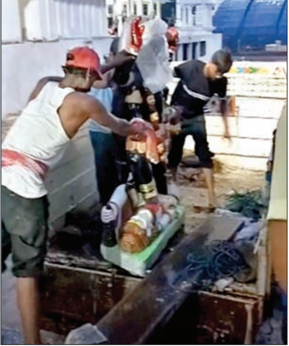
मंदिर के लिए आयी शिव परिवार की प्रतिमाएं उतारते मजदूर।