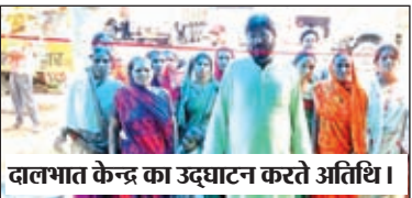
दालभात केंद्र का उद्घाटन करते अतिथि ।

बालूमाथ न्यू बस स्टैंड परिसर में सोमवार को मुख्यमंत्री दाल