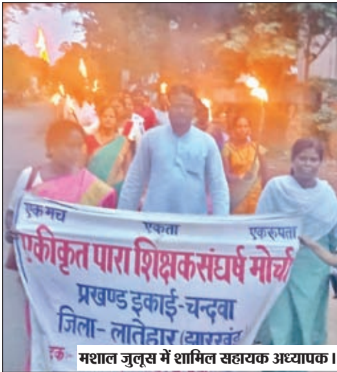
मशाल जुलूस में शामिल सहायक अध्यापक ।