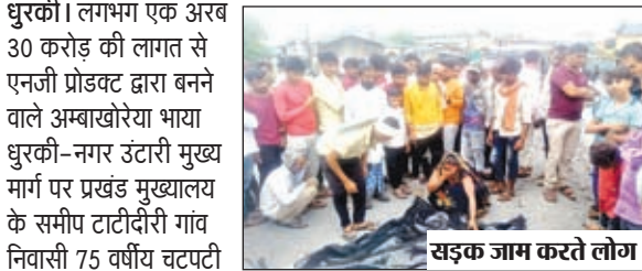
सड़क जाम करते लोग।