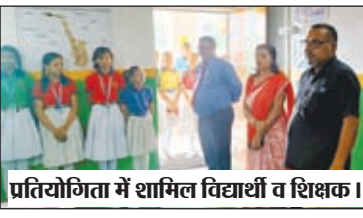
प्रतियोगिता में शामिल विद्यार्थी व शिक्षक ।

चंदवा। शहर से सटे सरोज नगर स्थित ग्रीनफील्ड एकेडमी सीनियर विंग प्रांगण में 5 दिवसीय शतरंज प्रतियोगिता का