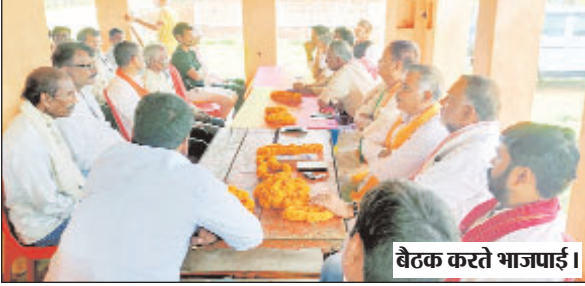
बैठक करते भाजपाई।