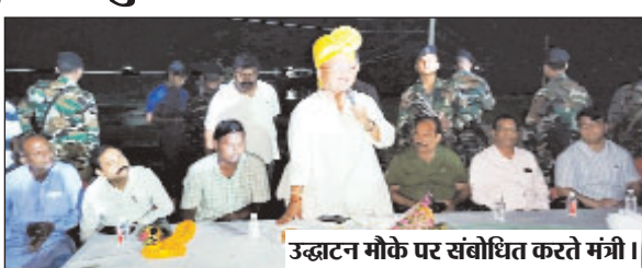
उद्घाटन मौके पर संबोधित करते मंत्री।