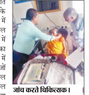
जांच करते चिकित्सक।