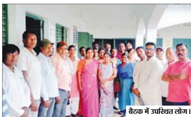
बैठक में उपस्थित लोग।