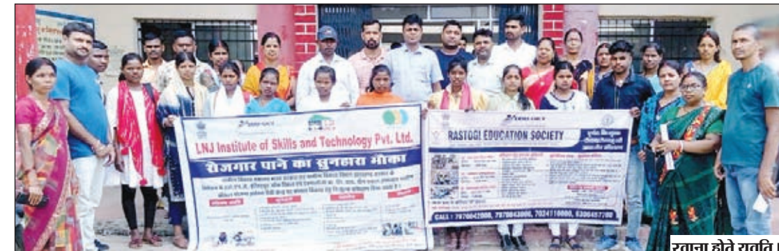
रवाना होते युवति।