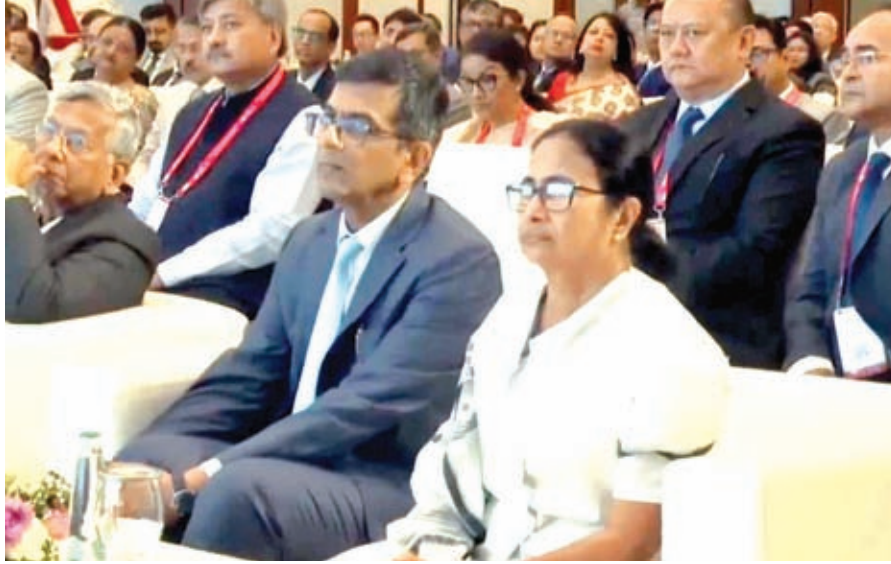
कलकत्ता हाई कोर्ट के बार एसोसिएशन की लाइब्रेरी के दो सौ साल पूरे होने पर विशेष परिचर्या मुख्य न्यायाधीश डीवाई चंद्रचूड़, बंगाल के सीएम ममता बनर्जी व अन्य।

है और जो चाहे खा सकता है। संविधान में दी गई स्वतंत्रता का हमेशा ख्याल रखना होगा। उन्होंने टेक्नोलॉजी का जिक्र करते हुए कहा कि इससे हमें बहुत सारे मौके मिले हैं। कोर्ट अपनी भाषा में जो फैसला सुनाता है उसे जिस भाषा में चाहें अनुवाद कर सकते हैं। हम लोगों (सुप्रीम कोर्ट) ने 51 हजार से अधिक आदेशों का कई भाषाओं में अनुवाद किया है। बंगाली और ओडिया सहित संविधान जिस किसी भी भाषा की स्वीकृति देता है, उन सभी भाषाओं में अनुवाद किया जा सकता है। उन्होंने कहा कि मैं बंगाली और ओडिया भाषा का जिक्र कर रहा हूँ, क्योंकि मेरी पत्नी ओडिया को बहुत पसंद करती हैं और बंगाली भी बहुत करीब है।