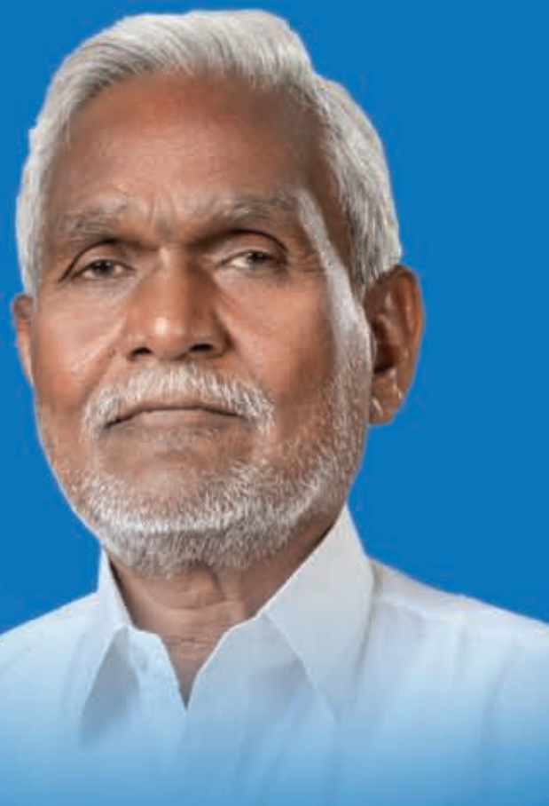
श्री चम्पाई सोरेन मुख्यमंत्री, झारखण्ड

आप कहीं से भी किसी भी थाने में जाकर FIR दर्ज करवा सकते हैं, वहां से संबंधित थाने में इसे भेज दिया जाएगा। आप ऑनलाइन या ई-मेल से भी प्राथमिकी दर्ज करवा सकते हैं।