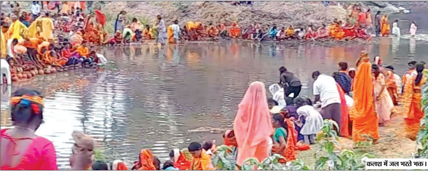
कलश में जल भरते भक्त।