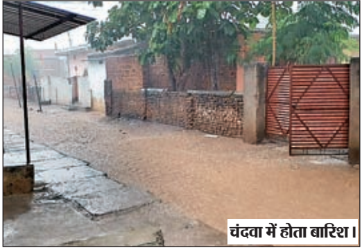
चंदवा में लेता बारिश।

चंदवा। पूर्वानुमान के अनुसार इस बार चंदवा में मानसून ने लगभग एक पखवारा देर से दस्तक दी है। मानसून के दस्तक देते ही चंदवा प्रखंड समेत आसपास के ग्रामीण इलाकों में शनिवार को झमाझम बारिश देखने को मिली है। अच्छी बारिश के कारण खेतों में पानी जमा हो गई है, साथ ही कई छोटे नदी नाले उफान पर आ गए हैं। वहीं देर से ही सही मानसून की शुरुआत के बाद किसान भी पूरी मुस्तैदी के साथ कृषि कार्य में जुट गए हैं। किसान धान के बिचड़े बोने के साथ-साथ मक्के की बुवाई की तैयारी शुरू कर दी है। कृषि कार्य शुरू होने के साथ ही बाजार में भी थोड़ी रीनक देखने को मिल रही है, कृषक भाई बीज खाद समेत कृषि उपकरण की खरीदारी को लेकर बाजार में देखे जा रहे हैं। बता दें कि इस वर्ष 15 जून तक चंदवा में मानसून के दस्तक देने की उम्मीद थी। लेकिन मानसून के चंदवा पहुंचने में लगभग एक पखवारा देर हो गई है। पिछले कई दिनों से चंदवा क्षेत्र में बारिश नहीं होने से किसान परेशान व चिंतित दिख रहे थे, लेकिन शनिवार से शुरू हुई झमाझम बारिश के बाद किसान काफी खुश देखे जा रहे हैं।