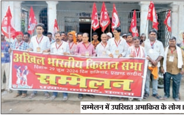
सम्मेलन में उपस्थित अभाकिस के लोग।