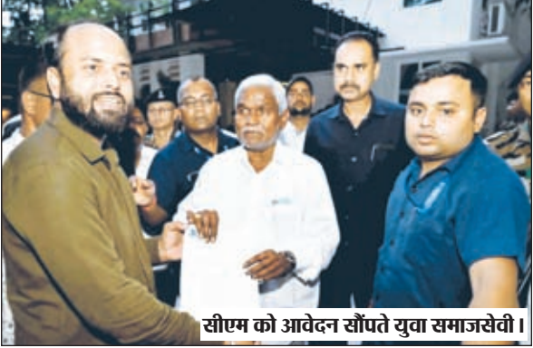
सीएम को आवेदन सौंपते युवा समाजसेवी।

कांडी। थाना क्षेत्र में काफी बड़े पैमाने पर डेटवाली सरकारी दवाएं फेंक दिए जाने के मामले में 103 दिन बाद भी कोई कार्रवाई नहीं किए जाने को लेकर सीएम से फरियाद की गई। सीएम ने तुरंत रिपोर्ट तलब कर दोषियों के विरुद्ध कड़ी कानूनी कार्रवाई का भरोसा दिलाया। कांडी के सतबहिनी के निकट एक गड्ढे में करीब पांच लाख रुपए की कामयाब सरकारी दवाएं फेंकी हुई पाई गई थी। यह 16 मार्च 2024 की घटना है। इस गंभीर