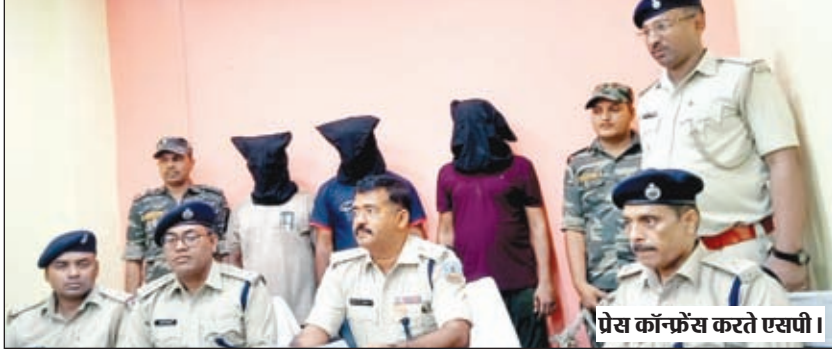
प्रेस कॉन्फ्रेंस करते एसपी।

कि उन्हें गुप्त सूचना मिली था कि एक काला भूरे रंग का मारुति स्विफ्ट कार (जेएच 01 सी एक्स 9759) से अज्ञात व्यक्तियों के द्वारा सासाराम, मोहनिया से ब्राउन शुगर खरीद कर गढ़वा में बिक्री किया जा रहा है। उन्होंने बताया कि इस सूचना के आधार पर अनुमंडल