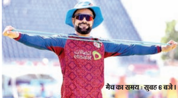
मैच का समय : सुबह 6 बजे।