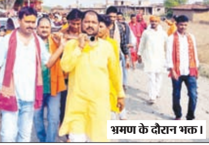
भ्रमण के दौरान भक्त।

मझिआंव। प्रखंड क्षेत्र के टड़हे पंचायत अंतर्गत गांव करुड़ में स्थित मां कामाख्या देवी की 26 जून दिन बुधवार को काफी धूमधाम से पहली वर्षगांठ मनाई गई। बताते चलें कि पिछले वर्ष गांव में स्थित देवी मंदिर के समीप नवनिर्मित मंदिर में मां कामाख्या मां की मूर्ति की स्थापना एवं प्राण प्रतिष्ठा वाराणसी से आए हुए विद्वानों के द्वारा कराया गया था। इस संबंध में मिली जानकारी के अनुसार सुबह 8 बजे मंदिर स्थल से मां की पालकी यात्रा सह नगर भ्रमण यात्रा निकाली गई। इसमें हजारों की संख्या में मां भक्तों ने भाग लिया। विशेष जानकारी देते हुए मां भक्त सह शाम 3 बजे से देर रात्रि तक भंडारे का आयोजन किया गया। कहा कि शाम 7 बजे से अर्खंड कीर्तन कार्यक्रम का आयोजन किया जाएगा। वहीं मां कामाख्या मंदिर को पूरे भव्य रूप एवं आकर्षक ढंग से सजाया गया था।