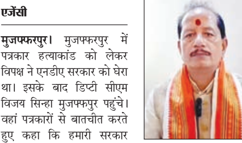
मुजफ्फरपुर से हुई है। यह राजद का काम नहीं है। एनडीए में किसी भी अपराधी बचेंगे नहीं।

जाण्णा डिप्टी सीएम ने कहा कि यह मुजफ्फरपुर की घरती है। अपराधी का एनकाउंटर करती है और यह गूँज अपराधी के कानों तक सुनाई देती है। अब 2005 के पहले वाली बात नहीं है। अब अपराधी को संरक्षण नहीं दिया जाता है। हमारी एनडीए की सरकार पूरी तरह से सजग और गंभीर है। एनडीए में किसी भी अपराधी को बख्शा नहीं जाएगा। इस मामले को हमारी सरकार बहुत ही