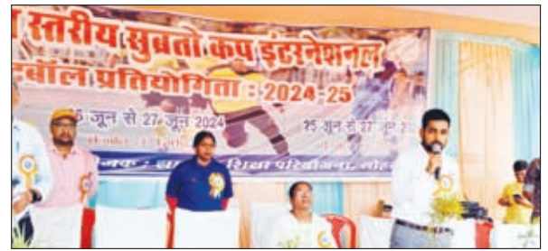
सम्बोधित करते डीडीसी