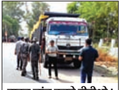
वाहन जांच करते डीटीओ।

वाहनों से डेढ़ लाख रुपये जुमाना राशि की हुई वसूली