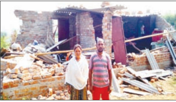
जंगली हाथियों से किसी तरह बचा दंपति व हाथियों द्वारा ध्वस्त घर

कई घर व फसल हुआ बर्बाद, घर के अंदर से जान बचाकर भागे दंपति