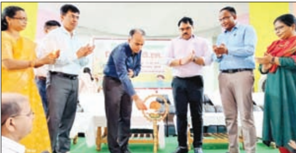
स्पेशल मेडिएशन ड्राइव शिफ्ट में शामिल न्यायिक पदाधिकारी व अन्य