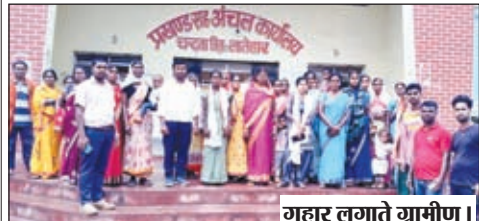
गुहार लगाते ग्रामीण।