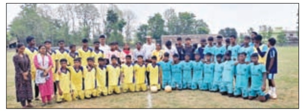
फुटबाल मैच में शामिल अतिथि व अन्य