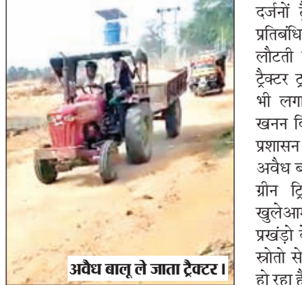
अवैध बालू ले जाता ट्रैक्टर।

रमना। प्रखंड में अवैध बालू का परिवहन और विक्रय का खेल खुलेआम हो रहा है। शासन-प्रशासन मौन बन कर बैठा हुआ है। अवैध बालू परिवहन और उंचे मूल्य पर क्षेत्र में हो रहे विक्रय का पता क्या प्रशासनिक पदाधिकारियों को नहीं है। प्रशासनिक व्यवस्था के नाक के नीचे यह अवैध कारोबार लंबे समय से फल फूल रहा है। फिर भी खनन विभाग के अधिकारी व प्रशासनिक पदाधिकारी अनजान बने हुए हैं। अवैध बालू कारोबारी चतुराई से रात के अंधेरे में बालू का अवैध खनन और परिवहन करते हैं, जो भोर 4-5 बजे तक चलता है। ग्रामीणों