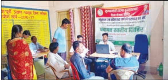
शिविर में उपस्थित लोग