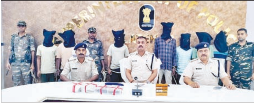
प्रेस वार्ता कर जानकारी देते एसपी

सभी की गिरफ्तारी सदर थाना क्षेत्र के इचाबार गांव से की गई है। पुलिस ने गिरफ्तार उग्रवादियों के पास से दो गोली लगा एक देशी रिवाल्वर, एक लोडेड देशी कट्टा, 315 बोर के चार गोली, चार मोबाइल, पांच हजार नगद, टीएसपीसी के तीन पर्चा व तीन