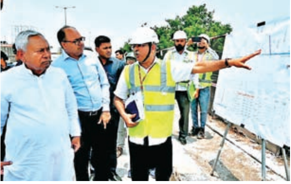
मीटापुर-पुनपुन फोर लेन के काम का भी जायजा लिया। करीब 11 किलोमीटर लंबी इस फोरलेन रोड

पटना। लोकसभा चुनाव संपन्न होने के बाद सीएम नीतीश कुमार प्रदेश में चल रही परियोजना की प्रगति की लगातार समीक्षा में जुटे हुए हैं। मुख्यमंत्री रविवार को भी पूरे एक्शन में दिखे जब उन्होंने राजधानी पटना में चल रही कई परियोजनाओं की प्रगति का जायजा लिया। इसी कड़ी में सीएम ने