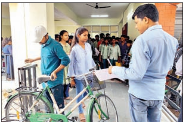
साइकिल वितरण करते अधिकारी