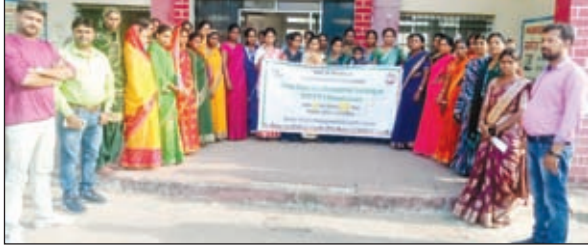
मौके पर मौजूद लोग