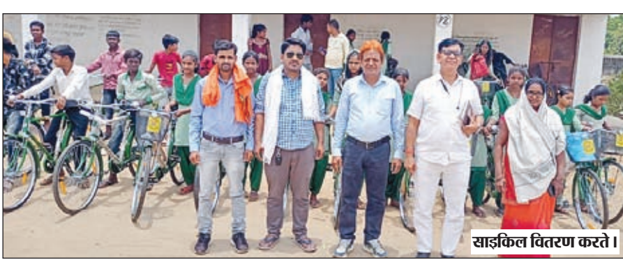
साइकिल वितरण करते।