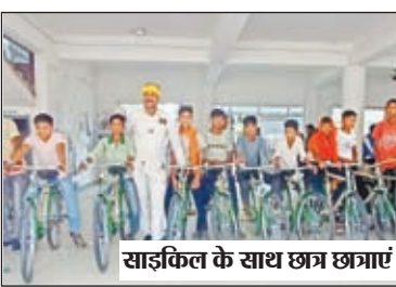
साइकिल के साथ छात्र छात्राएं।