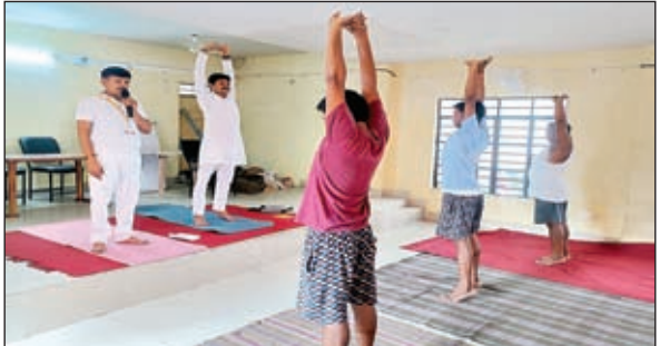
शिविर में उपस्थित लोग