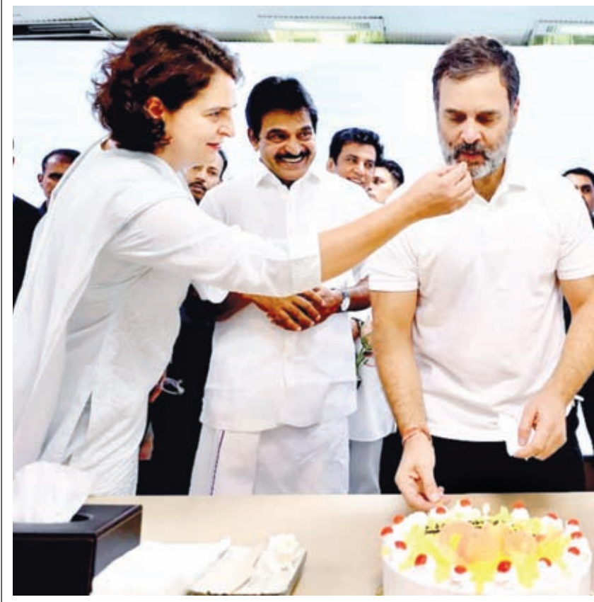
राहुल गांधी ने 54वें जन्मदिन के अवसर पर दिल्ली में काट केक। साथ में प्रियंका गांधी व अन्य।

अवसर पर लोगों को संबोधित करेंगे और उसके बाद योग सत्र में भाग लेंगे। प्रधानमंत्री केन्द्र शासित प्रदेश में 1500 करोड़ रुपये से अधिक की लागत से 84 प्रमुख विकासपरियोजनाओं का उद्घाटन और शिलान्यास करेंगे तथा कृषि और संबद्ध क्षेत्रों में प्रतिस्पर्धात्मकता सुधार परियोजना का भी शुभारंभ करेंगे। मोदी शुक्रवार सुबह श्रीनगर में 10वें अंतरराष्ट्रीय योग दिवस कार्यक्रम में हिस्सा लेंगे। वह इस