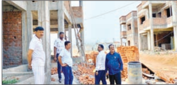
स्वास्थ्य केंद्र का निरीक्षण करते अधिकारी

ने निर्माण कार्य में लगे मजदूरों से बात करके बन रहे बिल्डिंग की गुणवत्ता के बारे में जानकारी लिया। साथ ही स्वास्थ्य केंद्र का निर्माण करवा रहे संवेदक से बात करके निर्माण का कार्य जल्द पूरा करने का निर्देश दिया। उन्होंने कहा की नए स्वास्थ्य केंद्र के निर्माण होने से