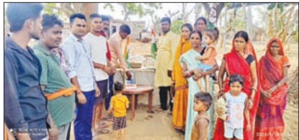
राहुल गांधी का जन्मदिन मनाते कांग्रेस के कार्यकर्ता