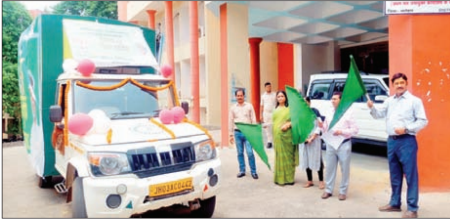
जागरूकता रथ को रवाना करते अधिकारी