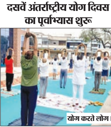
योग करते लोग।