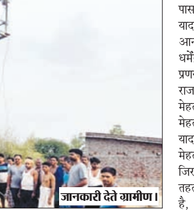
जानकारी देते ग्रामीण।

भवनाथपुर। प्रखंड अंतर्गत बनसाना पंचायत के जिरहुल्ला टोला में सरकार की महत्वाकांक्षी योजना हर घर नल जल योजना निर्माण में बड़े पैमाने पर गड़बड़ी एवं अनियमितता बरती गई है। उक्त योजना के संवेदक द्वारा तो बोरिंग कर जलमीनार तो खाड़ा कर दिया गया है, लेकिन टोला के किसी घर में पाइप लाईन नहीं बिछाया गया है, जिस कारण उस टोले के लोगों के घरों में इस तपिषा भरी प्रचंड गर्मी में जल की एक बूंद भी नसीब नहीं हो पा रही है। आलम यह है कि योजना