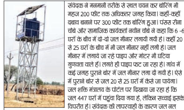
केतात गांव में लगी जलमीनार।

विश्रामपुर (पलामू)। विश्रामपुर प्रखंड के केतात कला पंचायत में अति महत्वकांक्षी योजना जल नल संवेदक की लापरवाही के कारण अनियमितता की भेंट चढ़ गया। संवेदक के द्वारा सारे नियम कानून को धटा बताकर कार्य किया जा रहा है। स्पलाई के लिए बिजली जाने वाली पाइप लाइन और वॉरिंग के लिए स्थानीय पंचायत