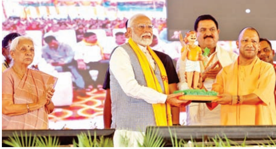
वनारस में मंगलवार को प्रधानमंत्री नरेन्द्र मोदी का स्वागत करते युपी के सीएम योगी आदित्यानथ।

प्रधानमंत्री ने कहा कि पीएम किसान सम्मान निधि दुनिया की सबसे बड़ी प्रत्यक्ष लाभ हस्तांतरण योजना बन गई है। उन्होंने कहा कि हम पैकेज्ड फूड के वैश्विक बाजार में देश को नई ऊंचाइयों पर ले जा रहे हैं। उनका सपना है कि दुनिया