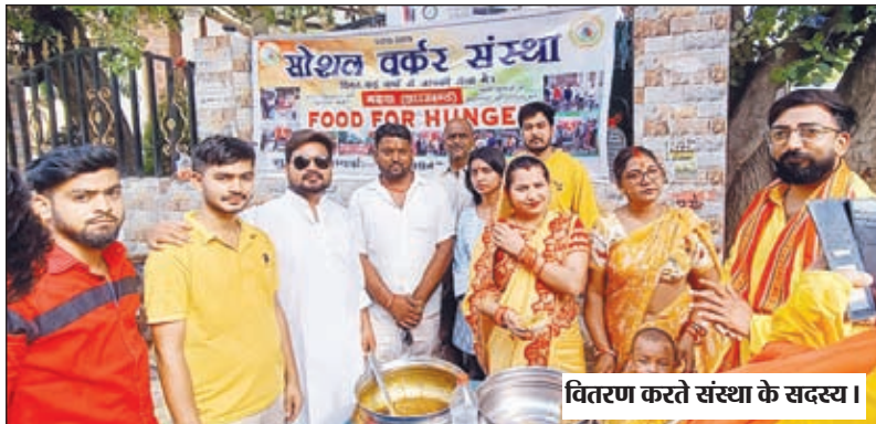
वितरण करते संस्था के सदस्य।