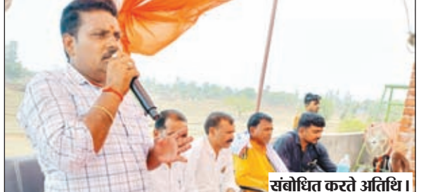
संबोधित करते अतिथि।