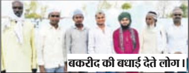
बकरीद की बधाई देते लोग।