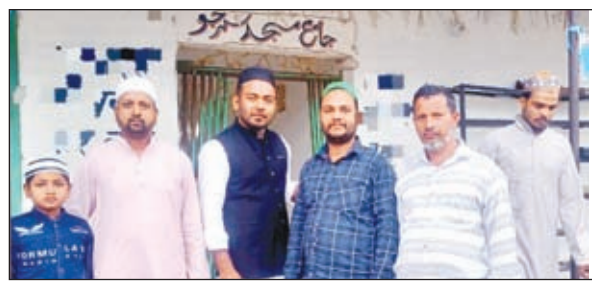
एक दूसरे को बधाई देते लोग