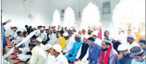
नमाज अदा करते मुस्लिम समुदाय के लोग