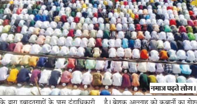
नमाज पढ़ते लोग।

गढ़वा। शहर में ईद-उल-अजहा का त्योहार अकीदत व मसरत के साथ मनाया गया। इस मौके पर मुस्लिम समुदाय के लोगों ने स्थानीय इदगाहों, मस्जिदों व मदर्सों में दो रिकअत वाजिब नमाज-ए-ईद-उल-अजहा अदा की। नमाज अदायगी को लेकर इन स्थलों पर सुबह से ही नमाजियों की भीड़ जमा होने लगी थी। नमाज अदा करने के बाद लोग एक दूसरे से गले मिलकर ईद-उल-अजहा की बधाई दी। वहीं घर पहुंच कर अकीदतमदों ने खुदा की राह बकरा की कुबानी पेश की। शहर व ग्रामीण क्षेत्रों के सभी नमाज अदायगी स्थलों पर इंतजामिया कमेटीयो के द्वारा नमाजियों की सुविधा के लिए ध्वनि विस्तारक यंत्र सहित अन्य इंतजाम किया गया था। वहीं पर्व के अवसर शांति व्यवस्था कायम रखने के लिए प्रशासन