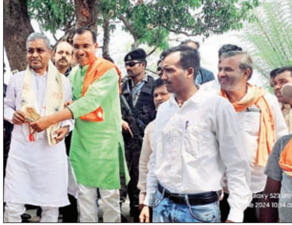
मौके पर मौजूद भाजपा प्रदेश अध्यक्ष सह पूर्व मुख्यमंत्री बाबूलाल मरांडी व अन्य

गारू। लोकसभा चुनाव के दौरान इंडिया गठबंधन ने भाजपा की फिर सरकार बनने से संविधान बदले जाने एवं दलित पिछड़े के आरक्षण समाप्त करने जैसे दुष्प्रचार किया गया उक्त बातें भाजपा प्रदेश अध्यक्ष सह पूर्व मुख्यमंत्री बाबूलाल मरांडी ने गारू में कही। श्री मरांडी गारू के कुई गांव पहुंचे थे जहां इस मिनिका विधानसभा के कुई मतदान केंद्र पर भाजपा को सर्वाधिक 82 फीसदी वोट मिले। इस अवसर पर भाजपा कार्यकर्ता एवं मतदाताओं को संबोधित करते हुए कहा कि विपक्षी