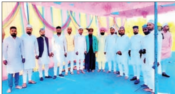
एक दूसरे को बधाई देते मुस्लिम समुदाय के लोग