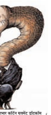
लेटर टू एडीटर

आनलाइन शिक्षा संयुक्त राष्ट्र के महासचिव के अनुसार कोविड-19 की अवधि में शिक्षा को बचाना इस समय सबसे मूल्यवान है। इस अवधि के दौरान शिक्षा बहुत अधिक प्रभावित हुई है। ऑनलाइन शिक्षा ही शिक्षा प्रदान करने का विकल्प बन गई है। शिक्षकों और छात्रों के बीच प्रत्यक्ष संपर्क समाप्त हो गया है। वर्तमान में देश ऐसी शिक्षा के लिए तैयार नहीं है।