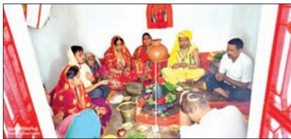
मौके पर मौजूद श्रद्धालुगण