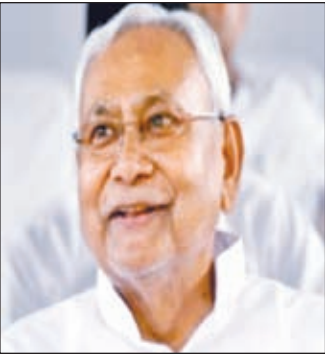
लोक न हो इसके लेकर एक सख्त कानून बनाने का निर्देश दिया। साथ ही कहा कि इससे संबंधित प्रस्ताव विधानसभा के सत्र प्रकाश की अनियमितता और प्रश्न पत्र