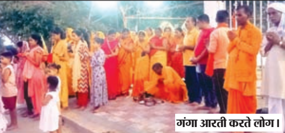
गंगा आरती करते लोग।