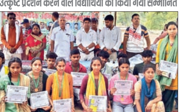
सम्मान समारोह में सम्मानित विद्यार्थियों व अतिथि