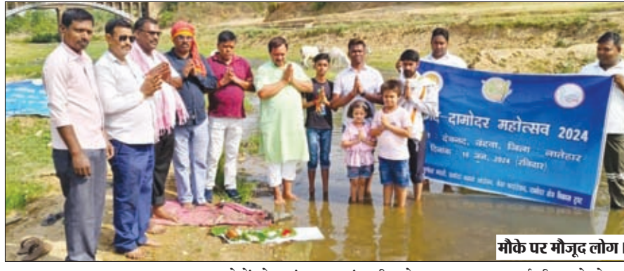
मौके पर मौजूद लोग।