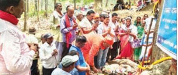
पूजा अर्चना करते लोग व कार्यक्रम में शामिल लोग

दामोदर नदी के उदगम स्थल चूल्हा पानी में आयोजित कार्यक्रम में पेड़ बचाने और लगाने का लिया गया संकल्प