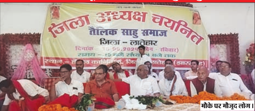
मौके पर मौजूद लोग।