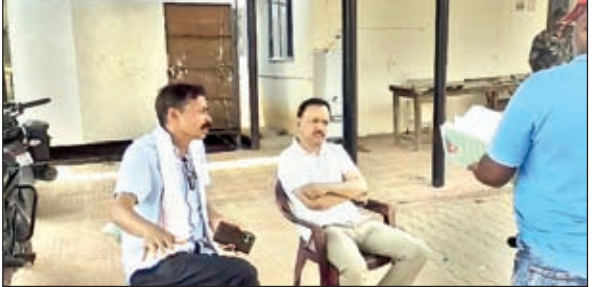
घटना की जानकारी लेते एसडीओ