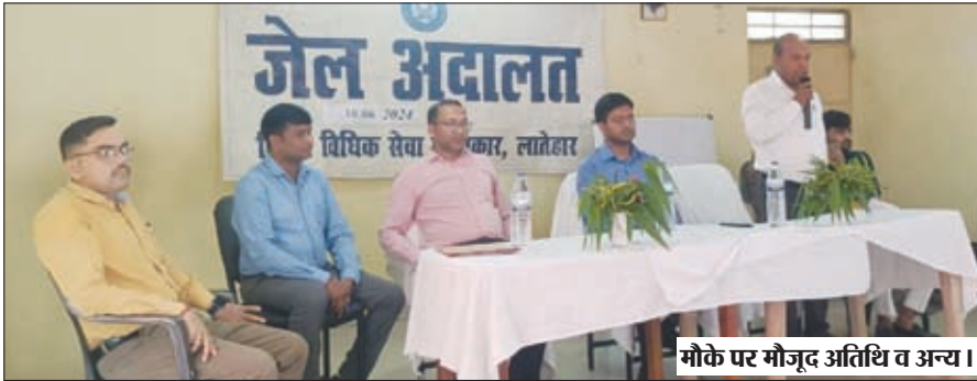
मौके पर मौजूद अतिथि व अन्य।