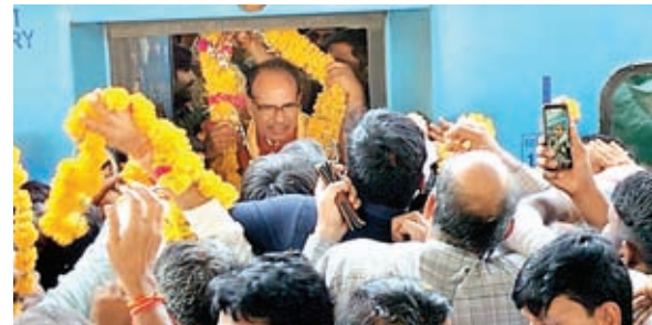
केन्द्रीय कृषि मंत्री शिवराज चौहान का मुंबई स्टेशन पर भव्य स्वागत।

मुंबई। केन्द्रीय कृषि एवं किसान कल्याण तथा ग्रामीण विकास पंचायत राज मंत्री शिवराज सिंह चौहान ने कृषि को भारतीय अर्थव्यवस्था की रीढ़ बताते हुए कहा कि किसान हमारा भगवान हैं और किसान की सेवा भगवान की सेवा है। कृषि एवं किसान कल्याण के लिए 100 दिन की कार्य योजना तैयार कर ली गई है। प्रधानमंत्री नरेन्द्र मोदी के नेतृत्व में तीसरी बार सरकार बनने पर सबसे पहले 18 जून को काशी से किसानों को सम्मान निधि की राशि प्रदान की जाएगी। प्रधानमंत्री मोदी सिंगल क्लिक के माध्यम से इस राशि को हस्तांतरित करेंगे। सरकार किसान