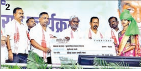
1. गोपाल मैदान के कार्यक्रम में आने पर रूँ हुआ सीएम का स्वागत। 2. एक लाभुक को चेक प्रदान करते सीएम चंपई सोरेन। साथ में मंत्री बन्ना गुप्ता व अन्य। 3. बन्ना गुप्ता से मंत्रणा के दौरान आवश्यक निर्देश देते मुख्यमंत्री चंपई सोरेन।