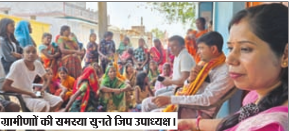
ग्रामीणों की समस्या सुनते जिप उपाध्यक्ष।