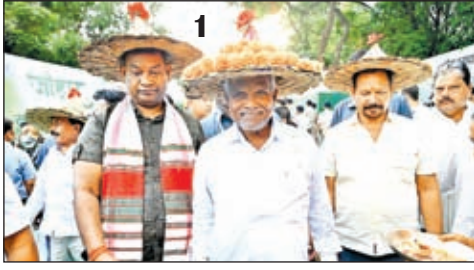
1. गोपाल मैदान के कार्यक्रम में आने पर रूँ हुआ सीएम का स्वागत। 2. एक लाभुक को चेक प्रदान करते सीएम चंपई सोरेन। साथ में मंत्री बन्ना गुप्ता व अन्य। 3. बन्ना गुप्ता से मंत्रणा के दौरान आवश्यक निर्देश देते मुख्यमंत्री चंपई सोरेन।

मुख्यमंत्री चम्पाई सोरेन की बड़ी घोषणा - 25 वर्ष से ज्यादा और 50 वर्ष से कम आयु की सभी बहनों और माताओं को आर्थिक सहयोग करेगी सरकार मुख्यमंत्री ने जमशेदपुर में 152 करोड़ 76 लाख 71 हजार रुपये की लागत वाली 182 योजनाओं का किया उद्घाटन शिलान्यास, 3 लाख 41 हजार 759 लाभुकों के बीच बांटे 68 करोड़ 96 लाख 67 हजार रुपये की परिसंपत्ति