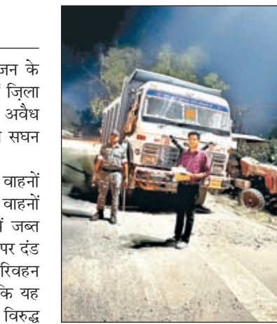
भी रोक लगेगी। मौके पर अन्य लोग मौजूद थे।