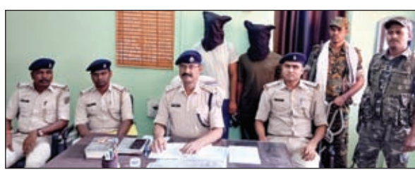
मामले की जानकारी देते प्रशासनिक अधिकारी।