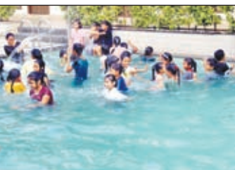
वस्तुओं (रही पेपर) से ब्राफ्ट वर्क कराया गया। तत्पश्चात तरणताल में शताधिक छात्रों ने फन विद टेट्ट एवं स्टोरी टेलिंग इत्यादि विषयों पर कार्यक्रम आयोजित किया गया। प्रातः योगाभ्यास से छात्रों के दिन की शुरुआत हुई। अनुपयोगी

थिरके। संगीत शिक्षक द्वारा आओ चले हमगीत सिखाया गया। कक्षा चौथी व पाँचवीं के छात्राओं ने पाककला में कला का विशिष्ट प्रदर्शन करते हुए झालमुड़ी एवं शीतल पेथ बनाकर सबको अर्चयित किया। कैम्प में इनडोर गेम का आयोजन किया गया, जिसमें बच्चों ने टेबल टेनिस, शतरंज, कैरम, लुडो आदि खेल में सहभागी बनकर लुप्त उठाया। नौवीं, ग्यारहवीं एवं बारहवीं के छात्रों को भी समर कैंप में कई गतिविधियां भी करावी गयीं।