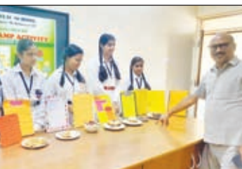
बच्चों की प्रतिभा को सराहते प्राचार्य और मस्ती करते ऑक्सफोर्ड स्कूल के बच्चे।

मेदिनीनगर। ऑक्सफोर्ड पब्लिक स्कूल में द्वितीय दिवस समरकैम्प हर्षोल्लास के साथ सम्पन्न हुआ। कैम्प के द्वितीय दिवस में योगा, तैराकी, पेंटिंग, जुम्बा डांस, संगीत, आर्ट-क्राफ्ट, पाककला, फोटोबुध, फन विद टेट्ट एवं स्टोरी टेलिंग इत्यादि विषयों पर कार्यक्रम आयोजित किया गया। प्रातः योगाभ्यास से छात्रों के दिन की शुरुआत हुई। अनुपयोगी