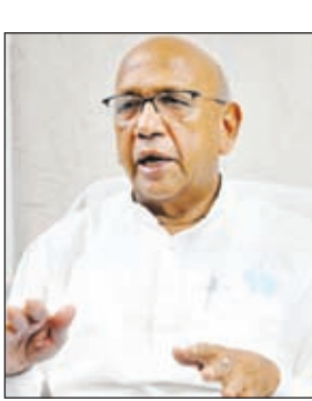
सरयू राय, विधायक।

जमीन आसमान का अंतर हो गया है, जिसके कारण पेयजल, बिजली, शहर की साफ-सफाई, आवासीय क्षेत्रों के जल निकास के नालों तथा सीवरेज-ड्रेनेज को सशक्त बनाने के लिए दोनों नगर पालिकाओं के बीच समन्वित तरीके से जो कार्य होना चाहिए वह नहीं हो पा रहा है। काफी पहले तय हुआ था कि मौनसून से पहले शहर के बड़े जल निकास नालों की सफाई कर दी जाएगी और नागरिकों के घरों से होकर बड़े नालों तक पानी ले जाने वाले नालियों को सुदृढ़ किया जाएगा, परंतु इस विषय में कोई खास प्रगति