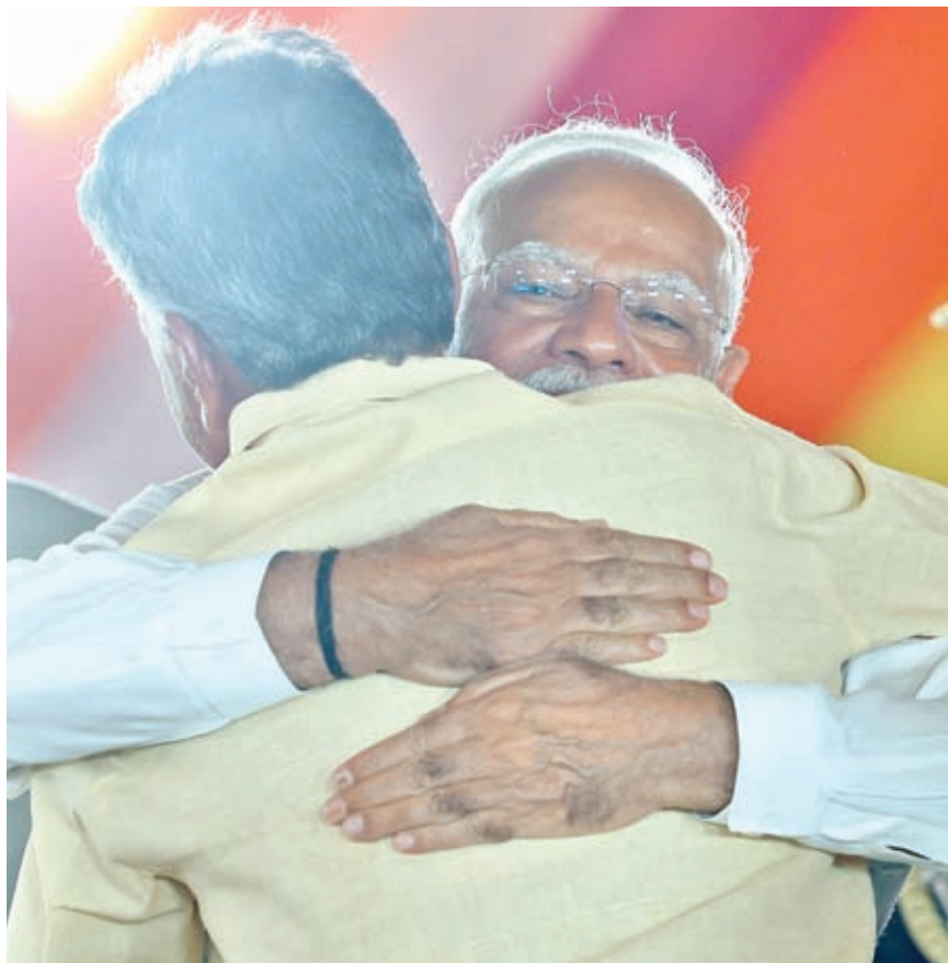
आंध्र प्रदेश के मुख्यमंत्री चंद्रबाबू नायडू से गले मिलते प्रधानमंत्री नरेंद्र मोदी