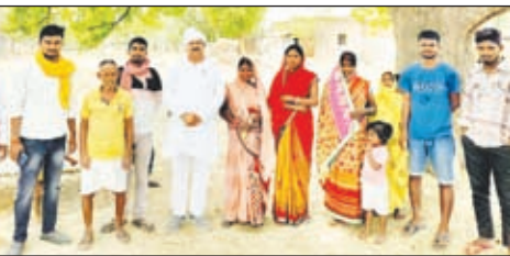
जनसंपर्क अभियान के दौरान उपस्थित लोग।

हुसैनाबाद (पलामू)। 19 जून को किसान खिगेड के तत्वावधान में हुसैनाबाद अनुमंडल मैदान में होने वाले किसान महापंचायत को लेकर किसान खिगेड की टीम लगातार पंचायत वड़ज जनसंपर्क अभियान चलाकर लोगों को जागरूक करने का काम कर