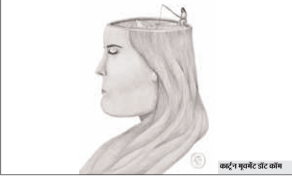
कार्टून म्यूजिक डॉट कॉम