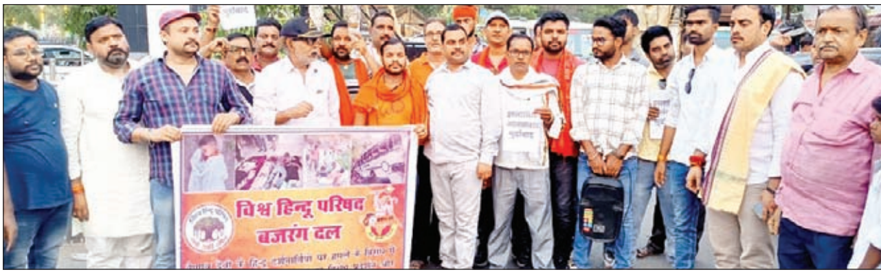
विरोध प्रदर्शन के बाद पुतला दहन करते विश्व हिंदू परिषद और बजरंग दल के लोग।

बताया गया कि जम्मू काश्मीर लंबे समय से पाकिस्तान पोषित आतंकवाद का देश झेल रहा है। धारा 370 के हटने के बाद एक आशा की ज्योति जगी थी। लेकिन, लमता है उग्रवादियों का मनोबल अभी भी कम नहीं हुआ है। हिंदुओं को चिन्हित करके उनकी हत्या की घटनाएं बढ़ी हैं। विश्व हिंदू परिषद-बजरंग दल के