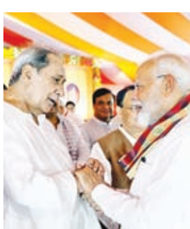
ओडिशा के नये सीएम के शपथ ग्रहण समारोह में पूर्व सीएम नवीन पटनायक से मिलते मोदी।

शेयर बाजार में तेजी संसेक्स 149 अंक चढ़ा मुंबई। अमेरिका में महंगाई के आकड़े आने से पहले विश्व बाजार के मिलेजुले रुख के बीच स्थानीय स्तर पर ऊर्जा, इंटरिद्वयत्स, यूटिलिटीज, केपिटल गुड्स और पावर समेत अठारह समूहों में हुई लिवाली की बदौलत बुधवार का शेयर बाजार में दो दिन बाद तेजी लौट गई। संसेक्स 149.98 अंक उल्लंकर 76,606.57 अंक पर पहुंच गया। निफ्टी 58 अंक चढ़कर 23,322 पर बंद हुआ।