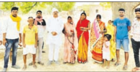
जनसंपर्क अभियान के दौरान उपस्थित लोग।

हुसैनाबाद (पलामू)। 19 जून को किसान खिगेड के तत्वावधान में हुसैनाबाद अनुमंडल मैदान में होने वाले किसान महापंचायत को लेकर किसान खिगेड की टीम लगातार पंचायत वाइज जनसंपर्क अभियान चलाकर लोगों को जागरूक करने का काम कर