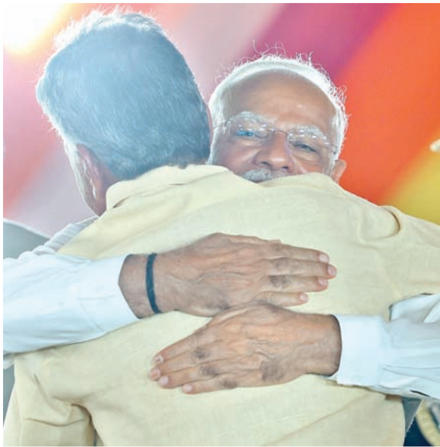
आंध्र प्रदेश के मुख्यमंत्री चंद्रबाबू नायडू से गले मिलते प्रधानमंत्री नरेंद्र मोदी

वाले शीर्ष नेताओं में अमेरिकी राष्ट्रपति जो बिडेन, फ्रांस के राष्ट्रपति एमैनुएल मैक्रों, जापानी प्रधानमंत्री फुमियो किशिदा और कनाडाई प्रधानमंत्री जस्टिन ट्रूडो शामिल होंगे। यूक्रेन के राष्ट्रपति वलोडिमिर जेलेन्स्की का भी अपने देश में जारी संघर्ष पर एक सत्र होगा। क्वात्रा ने बताया कि भारत स्विट्जरलैंड में यूक्रेन शांति शिखर सम्मेलन में उचित स्तर पर भाग लेगा। हालांकि शिखर सम्मेलन में भारत का प्रतिनिधित्व कौन करेगा इसकी अभी जानकारी नहीं दी।