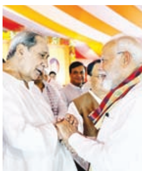
ओडिशा के नये सीएम के शपथ ग्रहण समारोह में पूर्व सीएम नवीन पटनायक से मिलते मोदी।

शेयर बाजार में तेजी संसेक्स 149 अंक चढ़ा मुंबई। अमेरिका में महंगाई के आकड़े आने से पहले विश्व बाजार के मिलेजुले रुख के बीच स्थानीय स्तर पर ऊर्जा, इंटरिद्वयत्स, यूटिलिटीज, केपिटल गुड्स और पावर समेत अठारह समूहों में हुई लिवाली की बदौलत बुधवार का शेयर बाजार में दो दिन बाद तेजी लौट गई। संसेक्स 149.98 अंक उल्लंघन 76,606.57 अंक पर पहुंच गया। निफ्टी 58 अंक चढ़कर 23,322 पर बंद हुआ।