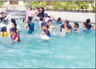
बच्चों की प्रतिभा को सराहते प्राचार्य और मस्ती करते ऑक्सफोर्ड स्कूल के बच्चे।

खबर मन्त्र संवाददाता मेदिनीनगर। ऑक्सफोर्ड पब्लिक स्कूल में द्वितीय दिवस समरकैम्प हर्षोल्लास के साथ सम्पन्न हुआ। कैम्प के द्वितीय दिवस में योगा, तैराकी, पेंटिंग, जुम्बा डांस, संगीत, आर्ट-क्राफ्ट, पाककला, फोटोबुध, फन विद टेट्ट एवं स्टोरी टेलिंग इत्यादि विषयों पर कार्यक्रम आयोजित किया गया। प्रातः योगाभ्यास से छात्रों के दिन की शुरुआत हुई। अनुपयोगी