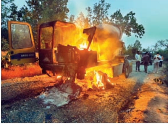
नक्सलियों द्वारा आगके हवाले फ्लोरी मशीन धु धु कर जलता हुआ