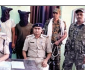
मामले की जानकारी देते प्रशासनिक अधिकारी।