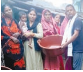
ताकि इस भीषण गर्मी में पशु पक्षी

उन्होंने कहा कि हम लोगों का दायित्व बनता है कि पशु पक्षियों की मदद के लिए टबों में पानी भरकर उसे पेड़ों के छंव में रखें।