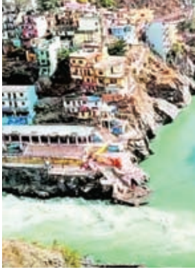
देवव्रत यानी भीष्म पितामह की मां गंगा थीं।

भारतीय संस्कृति में नदियों का धार्मिक और सांस्कृतिक ही नहीं, उनका ऐतिहासिक महत्व भी है। गंगा, यमुना, सरस्वती, नर्मदा, गोदावरी, कृष्णा और कावेरी ये महज धरती में बहती पानी की धाराएं भर नहीं, अपने आप में ये एक सभ्यता और संस्कृति को साथ लेकर बहती नदियां हैं। गंगा को भारतीय संस्कृति की आत्मा माना जाता है इसलिए इसे माता का दर्जा दिया जाता है।