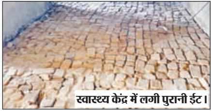
स्वास्थ्य केंद्र में लगी पुरानी ईट।

भवनाथपुर। सामुदायिक स्वास्थ्य केंद्र भवनाथपुर के डेढ़ दशक पुराने भवन का करोड़ों रुपए की लागत से हो रहे जीर्णोधार निर्माण में संवेदक के द्वारा काफी अनियमितता बरते जाने का मामला प्रकाश में आया है। उक्त जीर्णोधार योजना में अधूरे पड़े पुरानी भवन को ही मरम्मत कार्य करना है, जिसमें दोषम दर्जे की नदियों का बालू लाकर निर्माण कार्य में घड़ल्ले से उपयोग किया जा रहा है। इतनी गर्मी में भी कार्य के बाद निर्माण के दौरान पानी की तराई समय पर नहीं होने से दीवारों के बालू सूखकर झड़ने लगे है। एक तो डेढ़ दशक पुराना भवन है, जिसमें प्लास्टर, खिड़की, दरवाजे, फर्श का निर्माण कार्य चल रहा है। अधिकतर बाहरी मिस्त्री और मजदूर कार्य में लगे है, जो सबसे बड़ी बात है। वर्षों पुराने कई भवनों को जर्मीदोज कर उसमें से निकले पुराने ईट और छड़ को जीर्णोधार कार्य में