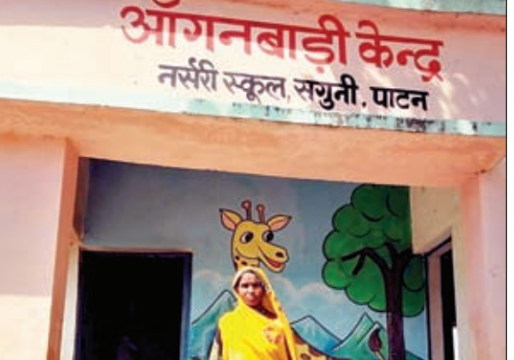
पाटन के सगुनी का आंगनबाड़ी केंद्र।