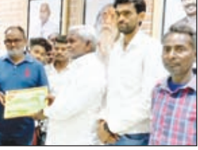
सीएम को आमंत्रण देने पहुंचे आयोजक।

गम्हरिया। श्री सार्वजनिक मां मनसा क्लब, बासुडुदा, गम्हरिया का एक प्रतिनिधिमंडल ने शुक्रवार को रांची स्थित आवास में मुख्यमंत्री चम्पाई सोरेन से मुलाकात की। इस दौरान उन्होंने मुख्यमंत्री को बासुडुदा में आगामी 15 जून को आयोजित होने वाले अंतर्राष्ट्रीय छऊ नृत्य कार्यक्रम में मुख्य अतिथि के रूप में शामिल होने के लिए आमंत्रण पत्र सौंपा। इस अवसर पर