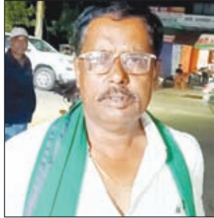
जातेगै जैसा कि हर जगह से सूचना प्राप्त हो रही है। भाजपा का न कोई कार्यकर्ता बूथ पर नजर आया न संगठन के कोई पदाधिकारियों का कोई बयान। लेकिन मतदाताओं के मुताबिक गोड्डा ग्रामीण क्षेत्रों में बीजेपी उम्मीदवार को काफी समर्थन मिला है। लेकिन कार्यकर्ताओं के बैगै ही प्रधान मंत्री मोदी के नाम पर मत प्राप्त हुए हैं। अब मतपेटी में उम्मीदवारों का भाग्य बंद हो चुका है और 4जून को खुशी हो या गम मतदाताओं ने अपना कार्य कर दिया है।