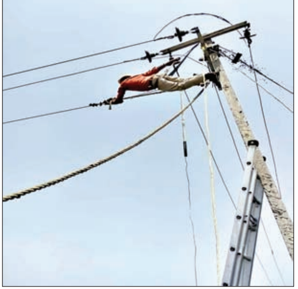
कार्य करते कर्मचारी