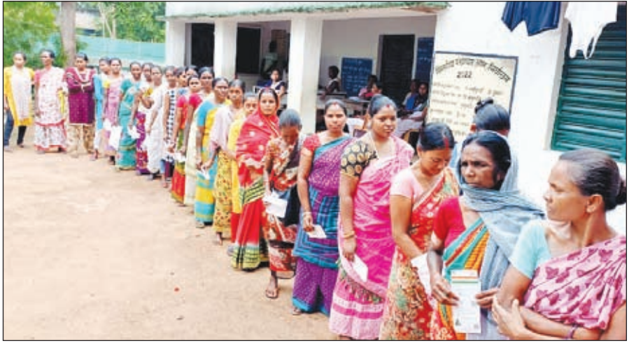
दुमका के एक मतदान केंद्र में मतदाताओं की लम्बी लंबी कतार।