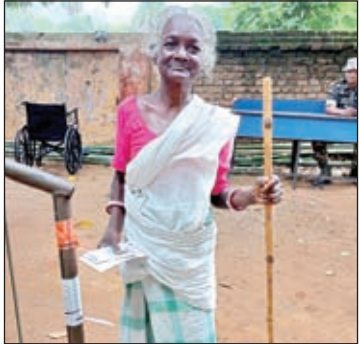
उत्साह : मतदान करने जाती बुजुर्ग महिला।