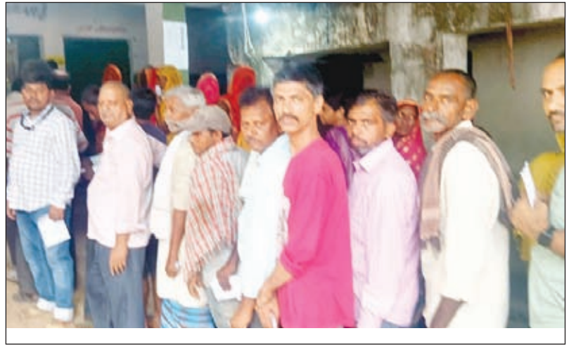
गोड्डा के बूथ पर अपनी बारी का इंतजार करते मतदाता।