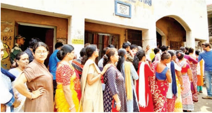
बंगाल के एक मतदान केंद्र पर लगी महिलाओं की लंबी कतार।

लोकतांत्रिक भावना पनपे। प्रधानमंत्री ने कहा कि मैं भारत की नारी शक्ति और युवा शक्ति की भी विशेष सराहना करना चाहूंगी। चुनावों में उनकी मजबूत उपस्थिति एक बहुत ही उत्साहजनक संकेत है। प्रधानमंत्री ने कहा, हमें विश्वास के साथ कह सकता हूँ कि भारत के लोगों ने राजग सरकार को लोभारा चुनने के लिए रिकॉर्ड संख्या में मतदान किया है। उन्होंने हमारा