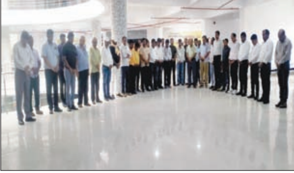
शोक मनाते डीसी व अन्य