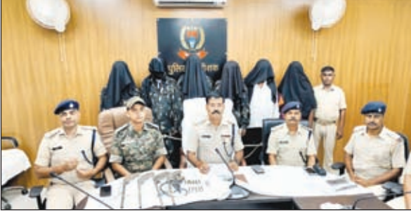
प्रेस कॉन्फ्रेंस करते एसपी व बरामद हथियार