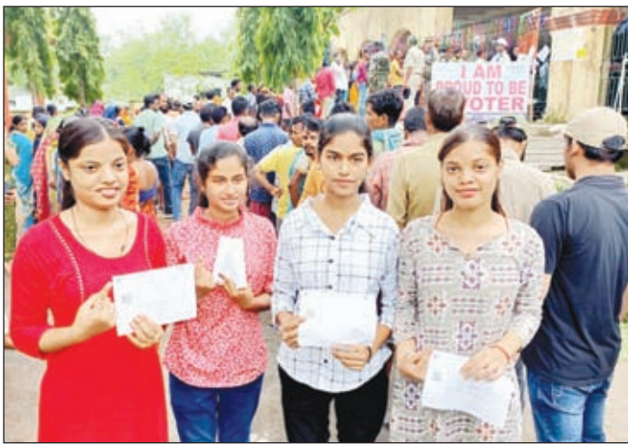
दुमका के एक बूथ में पहली बार मतदान कर खुशियां जताती युवतियां।