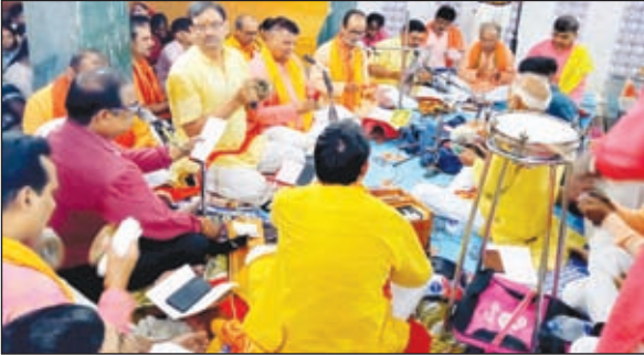
सुंदरकांड का पाठ करते लोग