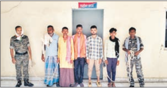
गिरफ्तार पशु तस्कर