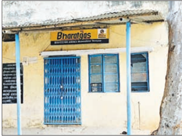
टाउनशिप स्थित भारत गैस एजेंसी