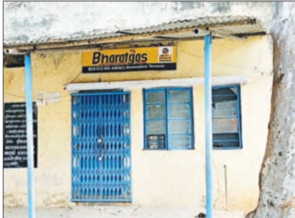
टाउनशिप स्थित भारत गैस एजेंसी