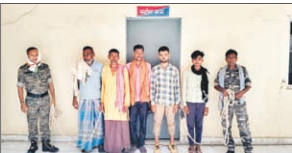
गिरफ्तार पशु तस्कर