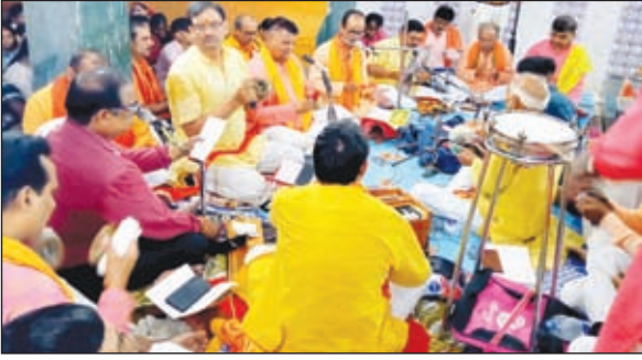
सुंदरकांड का पाठ करते लोग