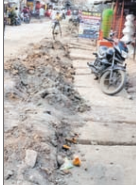
सड़क पर फैला मिट्टी-पत्थर