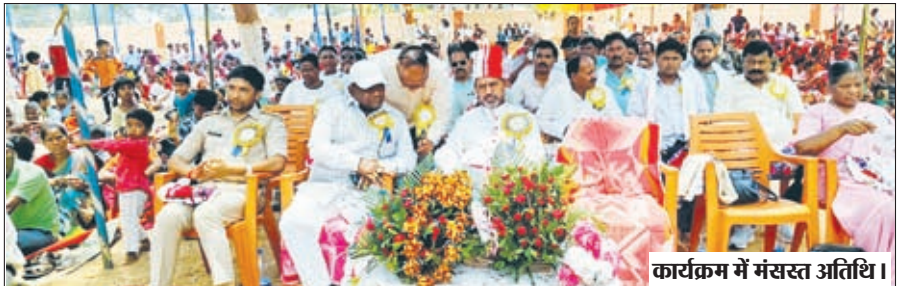
कार्यक्रम में मंसस्त अतिथि।