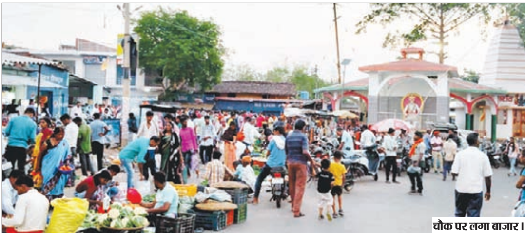
चौक पर लगा बाजार।