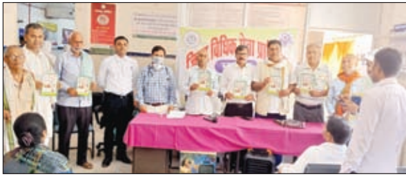
उपस्थित पीएलवी एवं चिकित्सा कर्मी