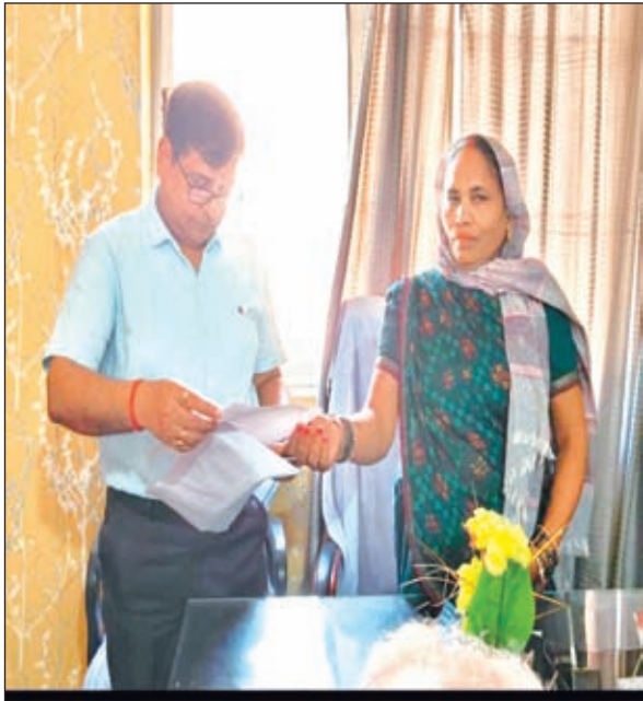
डीडीसी को आवेदन देती प्रमुख