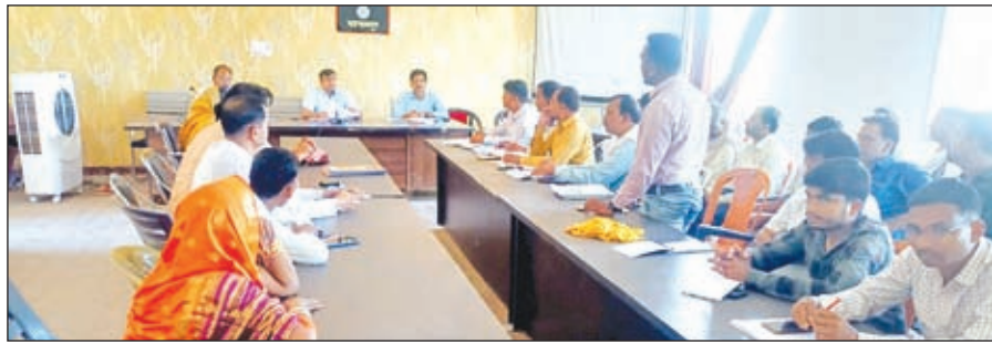
बैठक करते डीडीसी