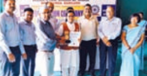
छात्रा को प्रामण-पत्र व ट्रॉफी देकर सम्मानित करते निदेशक व अन्य।

श्री अग्रसेन स्कूल में प्रतिभा सम्मान समारोह का हुआ आयोजन, मेधावी विद्यार्थियों को भिला सम्मान