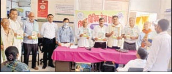
उपस्थित पीएलवी एवं चिकित्सा कर्मी