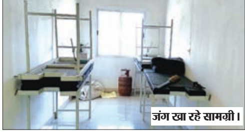
जंग खा रहे सामग्री।