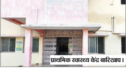
प्राथमिक स्वास्थ्य केंद्र बारियातू।