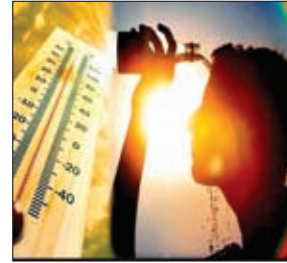
खबर मन्त्र संवाददाता

चतरा। शहर के लोग उमस भरी गर्मी से बेहाल हैं, घर के कमरों में रूकना भी मुश्किल हो रहा है। कूलर, पंखे और एसी भी गर्मी से राहत नहीं दे पा रहे हैं। पिछले आठ दिनों से तापमान लगातार बढ़ रहा है, सोमवार को अधिकतम तापमान