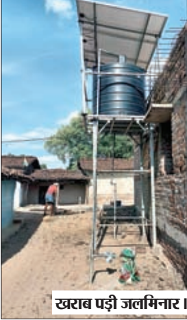
खराब पड़ी जलमिनार।