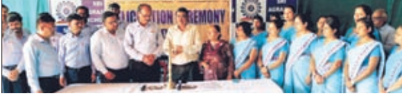
दीप जलाकर समारोह का उद्घाटन करते स्कूल के निदेशक व शिक्षक-शिक्षिकाएं।

श्री अग्रसेन स्कूल में प्रतिभा सम्मान समारोह का हुआ आयोजन, मेधावी विद्यार्थियों को भिला सम्मान