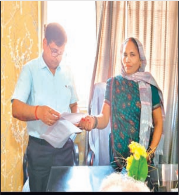
डीडीसी को आवेदन देती प्रमुख