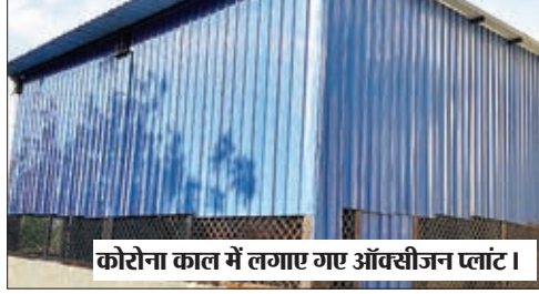
कोरोना काल में लगाए गए ऑक्सीजन प्लांट।

बारियातू प्रखंड क्षेत्र में घटना-दुर्घटना बाद-विवाद में चोटिल होने पर बारियातू प्रशासन को बालूमाथ जाना पड़ता है। वहीं वाद-विवाद में चोटिल होने पर प्रशासन को बारियातू से बालूमाथ ले जाना पड़ता है जिससे समय के साथ आर्थिक नुकसान भी होता है। अभी भी बारियातू प्रखंड क्षेत्र के 56 गांव के ग्रामीण हॉस्पिटल रहते चिकित्सक कर्मियों व जांच सुविधा के अभाव में बालूमाथ का चक्कर लगाना पड़ता है। उक्त बारियातू हॉस्पिटल में डॉक्टर, नर्स जांच सुविधा के लिए न तो विभाग सुधी लिया और न ही कोई प्रतिनिधि गंभीर हुए हैं।