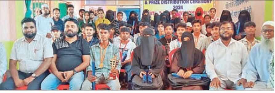
प्रतिभा सम्मान समारोह में सम्मानित विद्यार्थी अतिथियों के साथ।