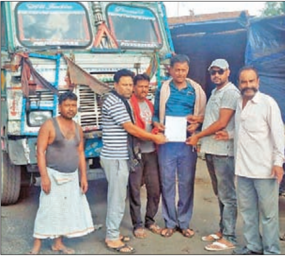
परेशान ग्रामीण आवेदन सौपते हुए

खलारी। खलारी सीमेंट फैक्टरी परिसर में सीमेंट की आड़ में कोयला के कारोबार से खलारी प्रखण्ड के ग्रामीणों को लगातार परेशानियों का सामना करना पड़ रहा है। सीमेंट फैक्टरी में कोल डंप साईडिंग में कोयला सीसीएल के अनेकों परियोजनाओं से लगातार दिन रात 24 घंटे कोयला ट्रकों व हाइवा से ट्रंसपोर्टिंग करने से आसपास के गाँवों व सड़कों में लगातार धूल गर्दा अथवा दुर्घटना का आसका बना रहता है। सीमेंट फैक्टरी में ट्रकों व हाइवा से कोयला ट्रंसपोर्टिंग अधिकतर रिहायसी एरिया के तरफ से किया जाता है। जो मानक रूप से अवैध है। फैक्टरी में कोयला ट्रंसपोर्टिंग बिना किसी के कानून का भय अथवा