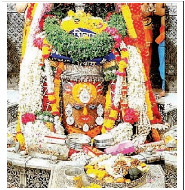
उज्जैन स्थित विश्व प्रसिद्ध ज्योतिर्लिंग भगवान महाकालेश्वर मंदिर में रविवार को ज्येष्ठ कृष्ण पक्ष की तृतीया के अवसर पर भगवान महाकाल का सूर्य रूपी विशेष भूंगा किया गया।