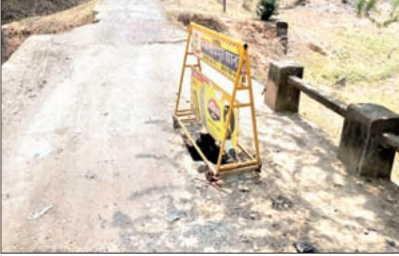
जीर्ण शीर्ष अवस्था में पुल