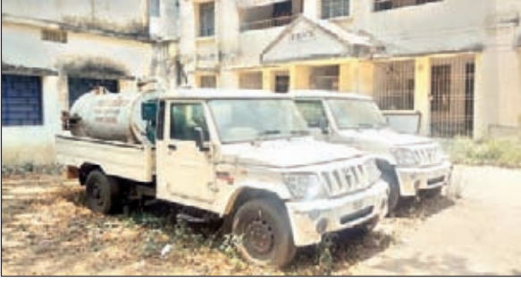
ब्लॉक कैम्प में खड़ा वाहन