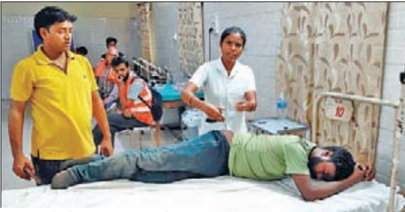
घायल लोगों का इलाज करते हुए