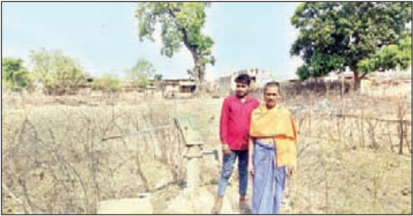
जानकारी देते ग्रामीण