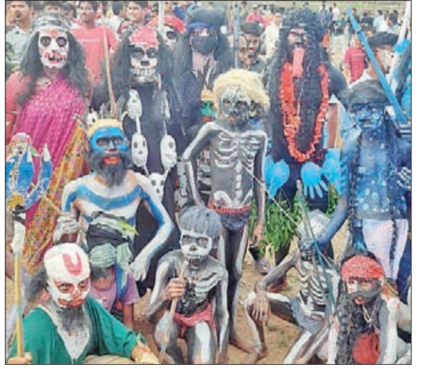
माता दुर्गा के भेष में सुसारी और भोक्ता

राहे। राह प्रखंड का प्रसिद्ध सुसारी पर्व का दुर्गा घट अनुष्ठान रविवार को संपन्न हुआ सोमवार की रात कालीघाट के साथ 9 दिनों से चल रहा पर्व संपन्न हो जाएगा। सुसारी पर्व मंडा पर्व का ही एक स्वरूप है। भोक्ताओं के सरदार सुसारी ने 9 दिनों तक राह स्थित मंदिर में शिव आराधना किया है। आठवें दिन रविवार को कोकोरो नदी किनारे स्थित श्मशान घाट से सुसारी को माता दुर्गा के भेष में शिव मंदिर तक लाया गया। इस दौरान रास्ते में कई बार सुसारी प्रतीकात्मक रूप से अपने चेतना खो हो जाता है। सुसारी को लाने के लिए सैकड़ों की संख्या में युवक भूत पिशाच का भेष बनाकर नाचते हुए राह शिव मंदिर तक आये। आधुनिकता के इस दौर में भी युवक अपने परंपरा को निभा रहे हैं। मान्यता है कि हम अपनी मन्मत पूरी होने पर युवक इस पर्व में भूत पिशाच का भेष लेते