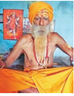
पकड़ा गया दुर्लभ प्रजाति का कुर्थिया नाग, महंत लालगिरी का फाईल फोटो

मिलने ही ग्रामीण और आसपास के क्षेत्र में शोक की लहर फैल गयी। लोग महंत के कमरे में गए जहां उन्हें बिस्तर में छिया कुर्थिया प्रजाति का नाग मिला जिसे लोगों ने पकड़ कर एक बाल्टी में रख लिया। इधर रविवार सुबह मामले की जानकारी