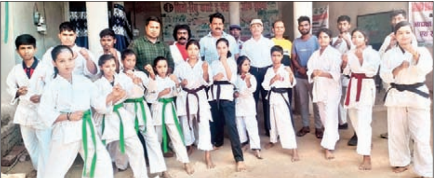
खिलाड़ियों के साथ अतिथि