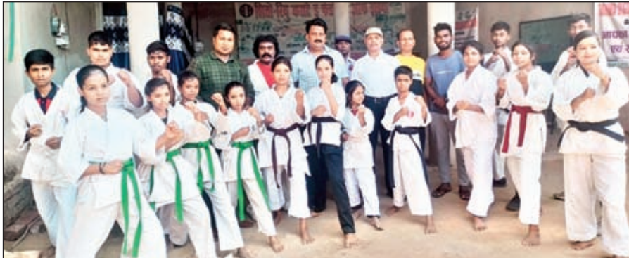
खिलाड़ियों के साथ अतिथि