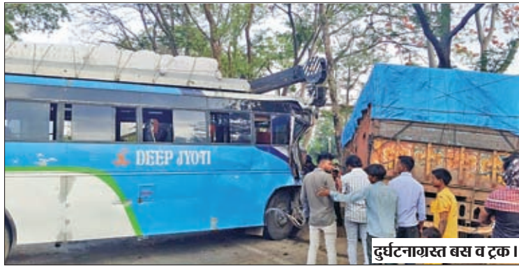
दुर्घटनाग्रस्त बस व ट्रक।

इधर दुर्घटना के संबंध में बताया जाता है कि जिस स्थान पर दुर्घटना हुई है, उस स्थान पर सड़क पर बड़ा-बड़ा गड्ढा बना हुआ है। घटनास्थल पर सामने से आ रहे ट्रक को साइड देने के लिए बस सड़क के बाईं ओर मुड़ी, जिसमें एनएच पर आने के क्रम में बस अस्तुलित हो गयी बस का आगे का हिस्सा ट्रक से सट गया। जिसके बाद दोनो वाहन का संतुलन बिगड़ गया, जिससे उक्त हादसा हुआ।