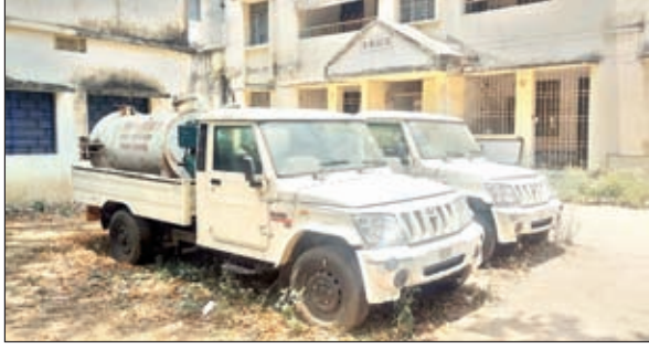
ब्लॉक कैम्प में खड़ा वाहन