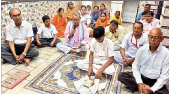
सत्संग में उपस्थित लोग