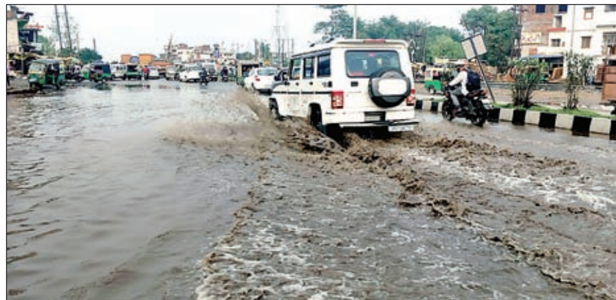
ओरमांडी में एनएच-20 पथ पर जमे पानी से बना तालाब।