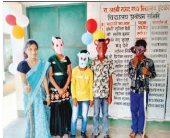
समर कैंप में भाग लेते बच्चे व अन्य।