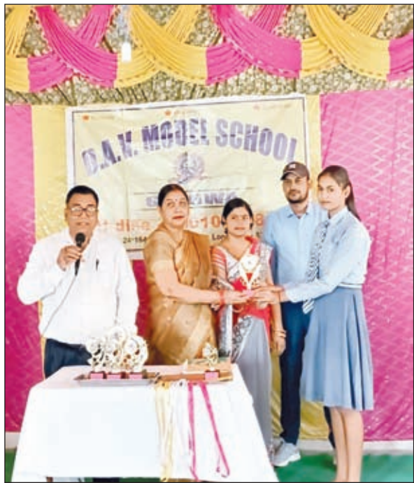
सम्मानित करते अतिथि