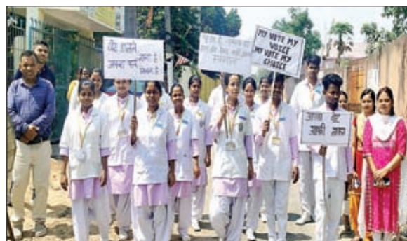
रैली में शामिल नर्सिंग की छात्राएं