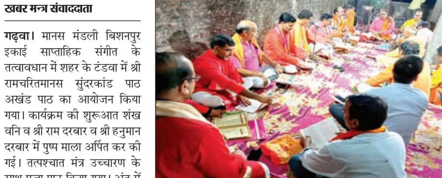
सुंदरकांड का पाठ करते लोग

मौके पर मंडली के सदस्यों ने कहा कि सुंदरकांड का पाठ करने से घर में सुख शांति की प्राप्ति होती है। विश्व का कल्याण होता है। शहर एवं ग्रामीण क्षेत्र में मंदिर एवं घरों में सुंदरकांड पाठ किया जाता है। सुंदरकांड का पाठ करने से संकट से मुक्ति मिलता है। मनुष्य को अपने जीवन में सुख शांति के लिए प्रत्येक